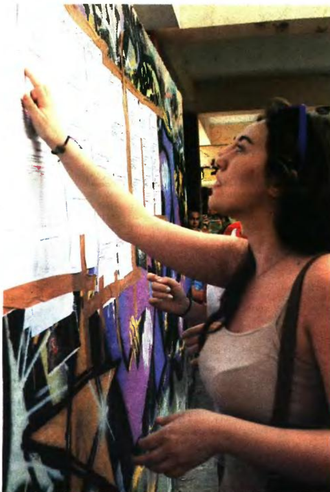
Πολύ καλή επιλογή, μεταξύ άλλων, αποτελεί το τμήμα Πληροφορικής Λαμίας (το 2015 η βάση ήταν 11.922 μόρια) για όσους ενδιαφέρονται να ασχοληθούν με τον κλάδο Πληροφορικής και την επιστήμη υπολογιστών

Επιλογικά, κρίνεται απαραίτητο ο κάθε υποψήφιος πριν οριστικοποιήσει το μηχανογραφικό του να εξετάσει προσεκτικά τα τμήματα στα οποία έχει πρόσβαση. Η εμπειρία έχει δείξει πως η πλειονότητα των μαθητών δεν έχει πλήρη επίγνωση των απαραίτητων δεδομένων, με αποτέλεσμα πολύ συχνά να κάνει λανθασμένες επιλογές ή και να παραλείπει επιλογές που θα οδηγούσαν στον επιθυμητό κλάδο και επάγγελμα.