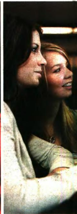
Πολύ σημαντικό είναι οι υποψήφιοι να ζητήσουν τις επόμενες ημέρες ενημέρωση για το αντικείμενο σπουδών και για το πρόγραμμα των σχολών που θα δηλώσουν στο μηχανογραφικό