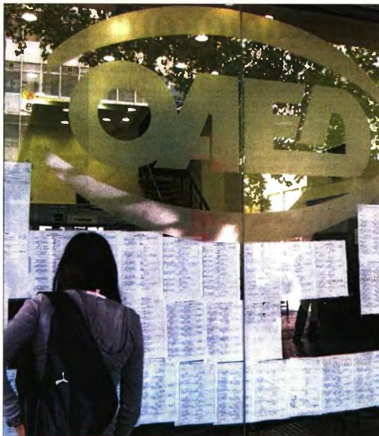
Το πρώτο πρόγραμμα αφορά την απασχόληση 1.295 ανέργων του ΟΑΕΔ, ηλικίας 25-29 ετών

Υπενθυμίζεται πως ο ΟΑΕΔ σκοπεύει να πιστοποιήσει στον κλάδο των τεχνολογιών, της πληροφορικής και των τηλεπικοινωνιών 1.000 ανέργους, ηλικίας 25-29 ετών, ενώ θα στηρίξει χρηματοδοτικά επιχειρηματικά σχέδια από 1.700 ανέργους νέους, ηλικίας 18-29 ετών.