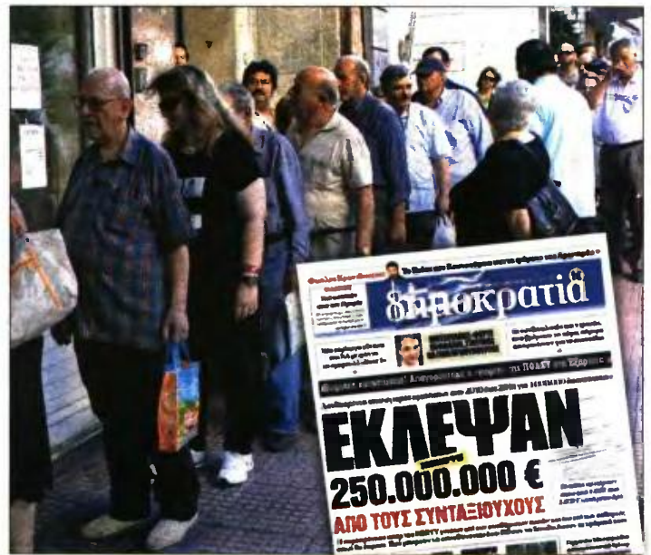
Οι συνταξιούχοι έχασαν πάνω από 250.000.000 ευρώ από ποσά που παρακρατήθηκαν υπέρ του ΕΟΠΥΥ. Δεξιά: Το πρόσφατο δημοσίευμα της «δημοκρατίας» που έφερε στο φως τη μεγάλη κλοπή των συνταξιούχων

Μετά την αποκάλυψη της «δημοκρατίας», έχουν κατατεθεί ήδη 3.000 αιτήσεις για τις λάθος παρακρατήσεις υπέρ του ΕΟΠΥΥ