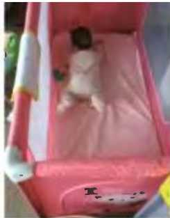
Από αριστερά και δεξιόστροφα: Η Αποστολία Χριστακάκη είναι η ανάδοχη μητέρα της 7χρονης σήμερα Φανής. Ένα από τα φιλοξενούμενα μωρά. Ο Ξενώνας βρεφών Πεντέλης. Η βρεφονηπιοκόμος Ιφιγένεια Χαλάτση. Η ζωγραφιά της μικρής Φανής.