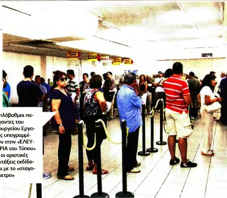
Υψηλόβαθμοι παράγοντες του υπουργείου Εργασίας υπογραμμίζουν στην «ΕΛΕΥΘΕΡΙΑ του Τύπου» ότι οι οριστικές συντάξεις εκδίδονται με το «σταγονόμετρο»

Μάλιστα, στους 38 τομείς των επικουρικών συντάξεων που ενσωματώθηκαν από 1/1/2017 στο ΕΤΕ-ΑΕΠ υπάρχει και το σοβαρότερο πρόβλημα αναφορικά με τον χρόνο απονομής των συντάξεων, καθώς στη συντριπτική τους πλειονότητα οι αιτήσεις παραμένουν «παγωμένες» επί 3,5 χρόνια, δηλαδή από τις αρχές του 2014, ενώ υπάρχει και ένας πολύ μικρός αριθμός αιτήσεων που αφορά τον Δεκέμβριο του 2013.