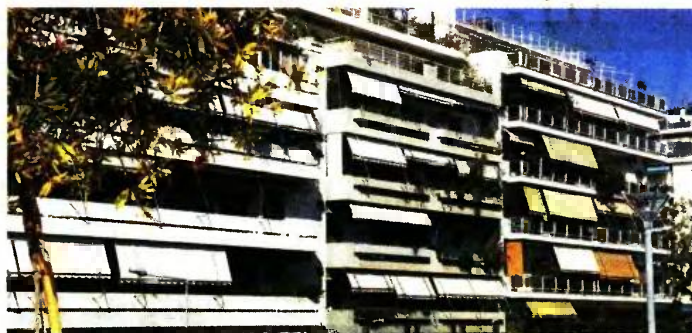
Ο ΕΝΦΙΑ του 2017 αναμένεται να αναρτηθεί στο TAXISnet τον Αύγουστο ή τον Σεπτέμβριο

Ρεπορτάζ Μάριος Ροζάκος mrozakos@dimokratianews.gr