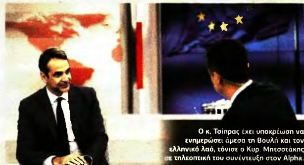
Ο κ. Τσίπρας έχει υποχρέωση να ενημερώσει άμεσα τη Βουλή και τον ελληνικό λαό, τόνισε ο Κυρ. Μπισσατάκης σε τηλεοπτική του συνέντευξη στον Alpha.

►► Ν.Δ.: 5 ΔΙΣ. ΠΡΟΣΘΕΤΑ ΜΕΤΡΑ ΧΩΡΙΣ ΝΑ ΠΑΡΟΥΜΕ ΤΙΠΟΤΑ