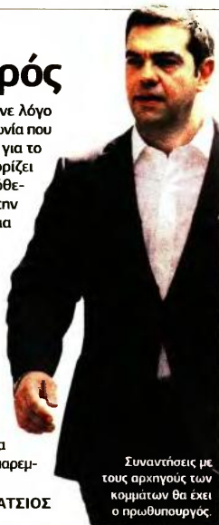
Συναντήσεις με τους αρχηγούς των κομμάτων θα έχει ο πρωθυπουργός.