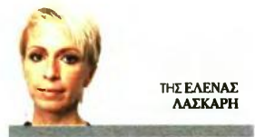
ΤΗΣ ΕΛΕΝΑΣ ΛΑΣΚΑΡΗ

Οι πρώτες ενδείξεις προς αυτή την κατεύθυνση αναμένονται την επόμενη εβδομάδα, όταν το ΔΝΤ θα δημοσιοποιήσει τις νεότερες προβλέψεις του για ανάπτυξη και πλεονάσματα (μέχρι σήμερα συνεχίζει να αμφισβητεί τον κυβερνητικό στόχο για πλεόνασμα 3,57% του ΑΕΠ του χρόνου, θέτοντας τον πάλιν στο 2,2% του ΑΕΠ), δείγμα προθέσεων αναμένεται να αλιεύσει ο Ευκλείδης Τσακαλώτος στο διάστημα 13-15 Οκτωβρίου στην επίσημη σύνοδο του Ταμείου στην Ουάσιγκτον, ενώ τα