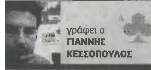
γράφει ο ΓΙΑΝΝΗΣ ΚΕΣΣΟΠΟΥΛΟΣ

Ε ίμαι 47 ετών, παιδί πολύτεκνης οικογένειας, πατέρας τρίτεκνης οικογένειας. Από τότε που θυμάμαι, ποτέ δεν υπήρξε μια σταθερή πολιτική για τη στήριξη της ελληνικής οικογένειας -μια πατριωτική αντίληψη της πολιτικής θα επέβαλε πάντοτε τη στήριξή της.