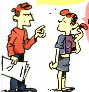
ΤΟΥ ΚΩΣΤΑ ΣΚΑΛΑΒΕΝΙΤΗ