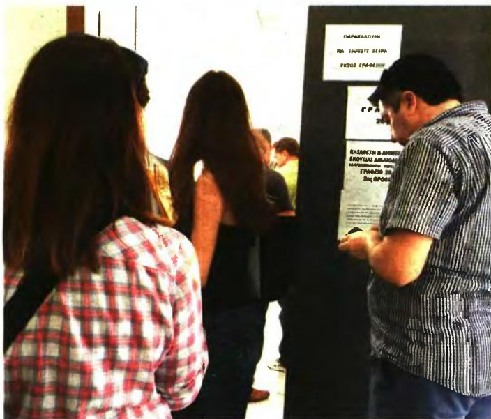
ΑΠΟ ΤΙΣ ΟΥΡΕΣ ΕΞΩ από τα γραφεία που λαμβάνουν τις αιτήσεις για την αποποίηση κληρονομιάς