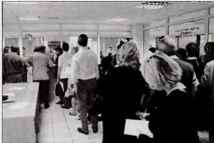
Η υφιστάμενη νομοθεσία για τον ΕΝΦΙΑ προβλέπει έκπτωση 50% ή ακόμη και απαλλαγή σε ιδιοκτήτες ακινήτων με χαμηλά εισοδήματα, τρίτεκνους, πολύτεκνους και ΑμεΑ, υπό την προϋπόθεση ότι έχουν υποβάλει εμπρόθεσμα τις φορολογικές τους δηλώσεις, αλλά και τις δηλώσεις Ε9

Δεύτερο σενάριο: Αφορά στη θέσπιση του νέου φόρου ακινήτων, ο οποίος θα υπολογίζεται με βάση περισσότερα κλιμάκια και συντελεστές και θα προβλέπει ελαφρύνσεις για τις μικρές ιδιοκτησίες μέσω της μεταφοράς του φορολογικού βάρους στις μεγάλες περιουσίες. Το σενάριο αυτό, αν δεν καταστεί εφικτό να εφαρμοσθεί από το 2017, σε κάθε περίπτωση θα τεθεί σε εφαρμογή το 2018, όπως σημειώνουν αρμόδιες πηγές του υπουργείου Οικονομικών. Υπενθυμίζεται ότι