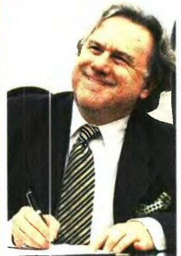
Ο υπουργός Εργασίας Γ. Κατρούγκαλος επιβεβαίωσε το αποκλειστικό ρεπορτάζ του «Ε.Τ.».