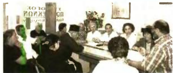
Των εκλογών, προηγήθηκε η απολογιστική Γ.Σ και η έκθεση της Εξελεγκτικής Επιτροπής.

Το νέο Δ.Σ θα συγκροτηθεί σε σώμα εντός της εβδομάδας.