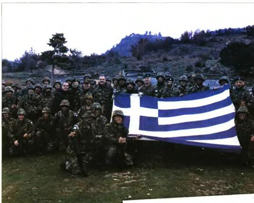
Ο υποστράτηγος Αμυνας Πάνος Καμμένος και ο αρχηγός ΓΕΣ Αλκιβιάδης Στεφανίδης με εθνοφύλακες που συμμετέχουν σε άσκηση στη θάλασσα

Εντυπωσιακή αύξηση συμμετοχής από το 9% στο 25% στις ασκήσεις και τις εκπαιδευτικές βολές μετά την ενεργοποίηση των δύο θεσμών από το υπ. Αμυνας για τη στελέχωση στρατιωτικών μονάδων της παραμεθορίου