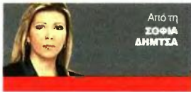
Από τη ΣΟΦΙΑ ΔΗΜΤΣΑ

Η κυβέρνηση θα ψηφίσει σκληρά μέτρα (ύψους 4,3 δισ. ευρώ) έως το 2020, χωρίς καμία ελάφρυνση, αφού ήδη οι Γερμανοί έχουν προειδοποιήσει πως δεν θα δεχθούν πάγωμα επιτοκίων