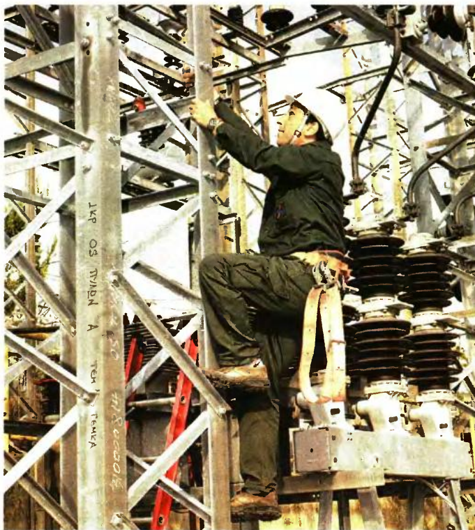
Στο ΑΣΕΠ βρίσκεται και το αίτημα πρόσληψης 76 μονίμων υπαλλήλων σε ειδικότητες Διοικητικών και Τεχνικών, που έχει υποβάλει ο ΑΔΜΗΕ

■ Ετοιμη είναι η νέα προκήρυξη της ΕΥΔΑΠ για 300 μόνιμους υπαλλήλους και εκτιμάται πως θα υποβληθεί στο ΑΣΕΠ μέσα στις