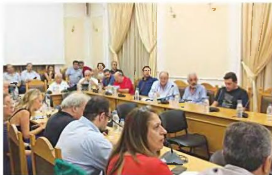
Οι φορείς που έδωσαν το "παρών" κατέθεσαν προτάσεις, σκέψεις και παρατηρήσεις.