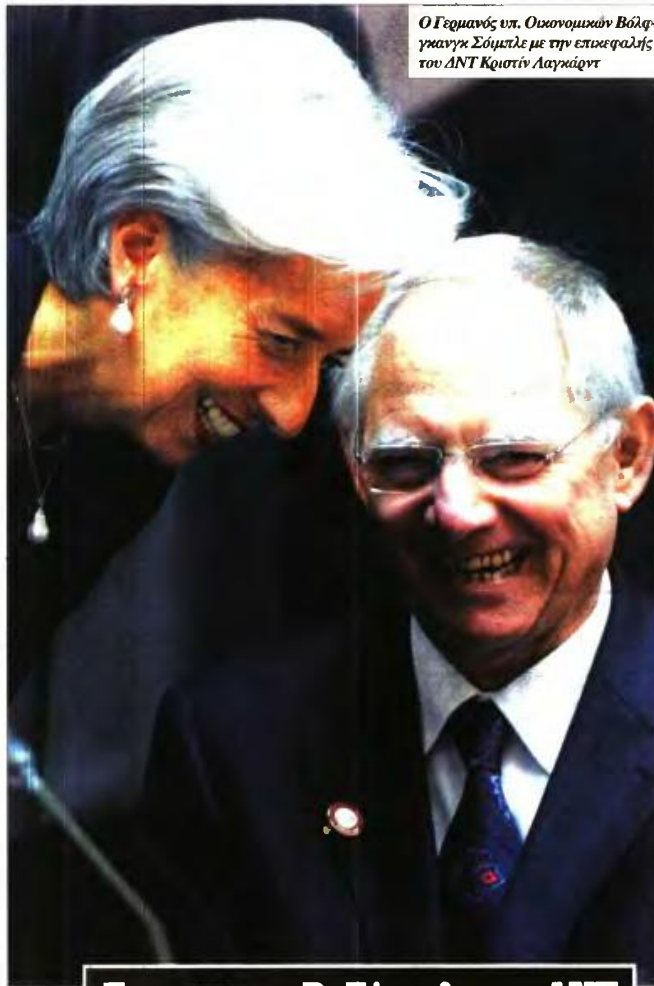
Ο Γερμανός υπ. Οικονομικών Βόλφγκανγκ Σόιμπλε με την επικεφαλής του ΔΝΤ Κριστίν Λαγκάρντ