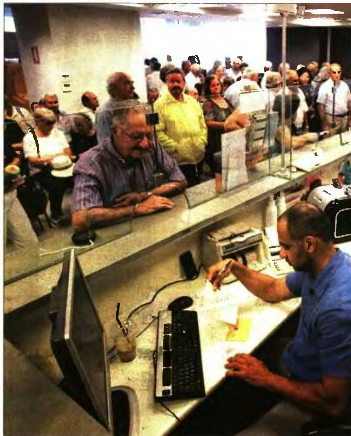
Η εγκύκλιος αναμένεται να «ξεπαγώσει» τις 129.000 αιτήσεις για επικουρική σύνταξη που βρίσκονται στην αναμονή εδώ και 2,5 χρόνια