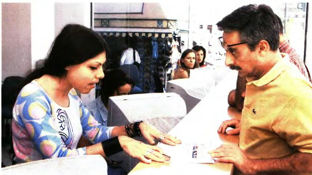
Ασφαλισμένοι στο Δημόσιο με 25ετία και ανήλικο τέκνο το 2012 δικαιούνται σύνταξη στα 55 αν έπιασαν το όριο μέχρι τις 18 Αυγούστου 2015

8 Μπότερες στο Δημόσιο με 25ετία και ανήλικο τέκνο μέχρι τις 31 Δεκεμβρίου 2010. Αν έγιναν 50 μέχρι τις 18 Αυγούστου