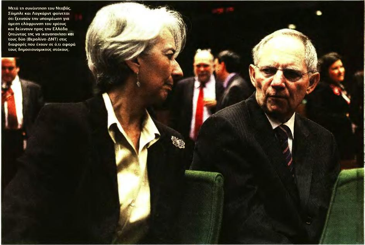
Μετά τη συνάντηση του Νταβός, Σόιμπλε και Λαγκάρντ φαίνεται ότι ξεκινούν την υποχρέωση για άμεση ελάφρυνση του χρέους και δείχνουν προς την Ελλάδα ζητώντας της να ικανοποιήσει και τους δύο (Βερολίνο-ΔΝΤ) στις διαφορές που έχουν σε ό,τι αφορά τους δημοσιονομικούς στόχους.

ΣΟΪΜΠΛΕ - ΛΑΓΚΑΡΝΤ: ΠΡΟΕΙΔΟΠΟΙΗΣΗ ΣΤΗΝ ΚΥΒΕΡΝΗΣΗ ΟΤΙ ΤΟ ΠΡΟΓΡΑΜΜΑ ΘΑ ΤΕΡΜΑΤΙΣΤΕΙ ΑΝ ΔΕΝ