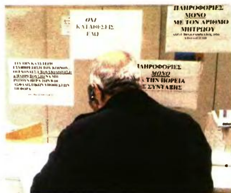
ΤΟ ΕΛΕΓΚΤΙΚΟ Συνέδριο μελετάται να αναλάβει την επίλυση του συνόλου των συνταξιοδοτικών εισφορών