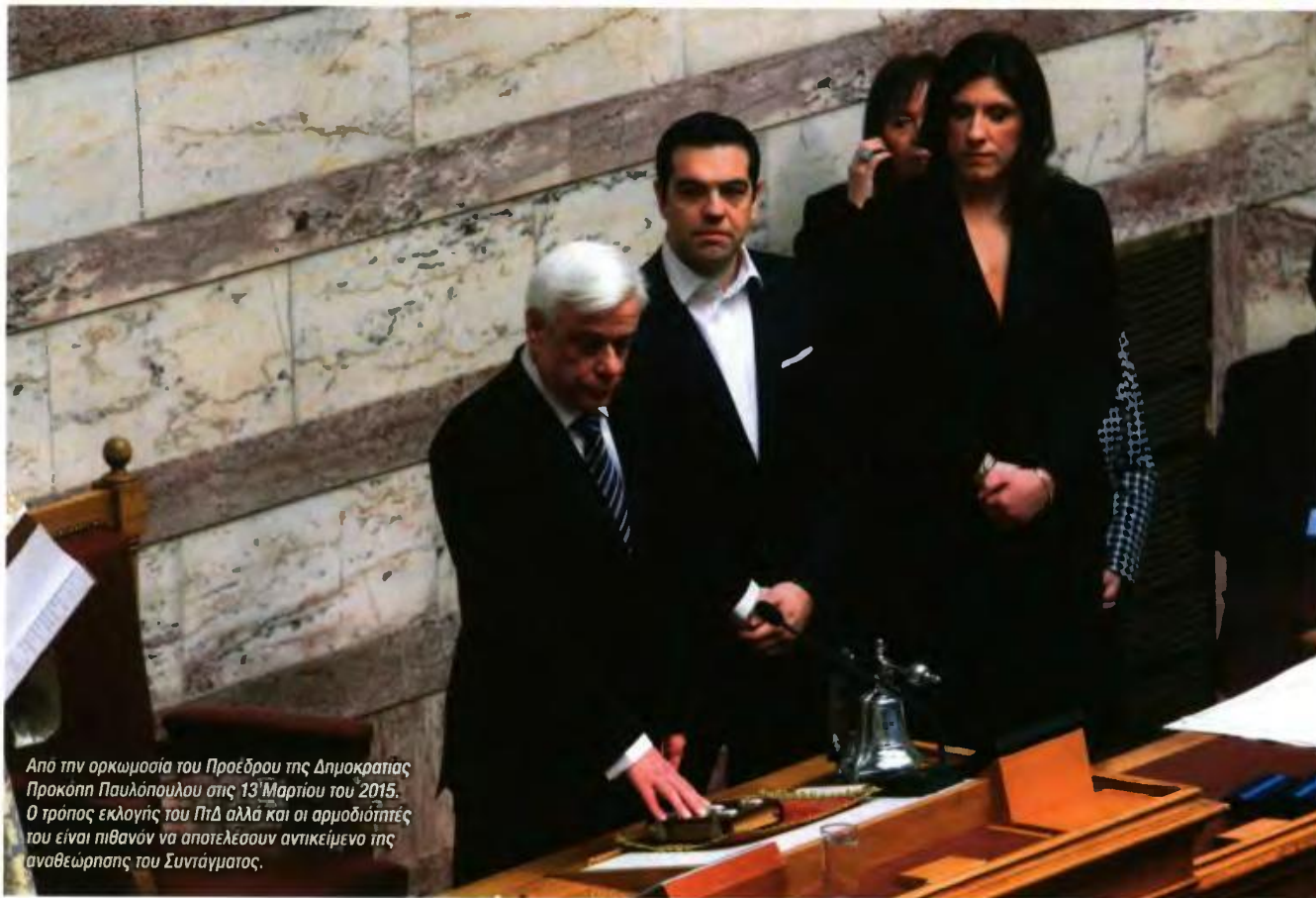
Από την ορκωμοσία του Προέδρου της Δημοκρατίας Προκόπη Παυλόπουλου στις 13 Μαρτίου του 2015. Ο τρόπος εκλογής του ΠτΔ αλλά και οι αρμοδιότητές του είναι πιθανόν να αποτελέσουν αντικείμενο της αναθεώρησης του Συντάγματος.