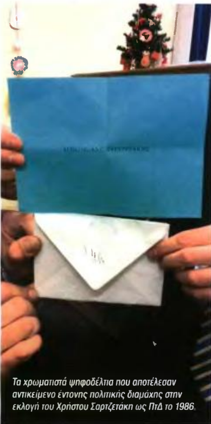
Τα χρωματιστά ψηφοδέλτια που αποτέλεσαν αντικείμενο έντονης πολιτικής διαμάχης στην εκλογή του Χρήστου Σαρτζετάκη ως ΠτΔ το 1986.

μικρός, αφού σχεδόν συμπίπτει με την θητεία μιας κυβέρνησης. Έτσι, ο κίνδυνος το κείμενο του Συντάγματος να μετατραπεί σε αντικείμενο πολιτικού παιχνιδιού της κάθε κυβέρνησης είναι υπαρκτός. Αναμφισβήτητα ο εκσυγχρονισμός του και η εξέλιξή του παράλληλα με τις κοινωνικές ανάγκες είναι αναγκαίος, εντούτοις ελλοχεύει ο κίνδυνος, ιδιαίτερα στην Ελλάδα, αυτό να γίνει πεδίο κομματικής ενασχόλησης. Πριν η χώρα οδεύσει σε «συνταγματικά αναθεωρητική κόπωση» θα ήταν σκόπιμο ο χρόνος να διπλασιαστεί. Δεν υπάρχει ανάγκη εμπειριστωμένης ανάλυσης για το παραπάνω.