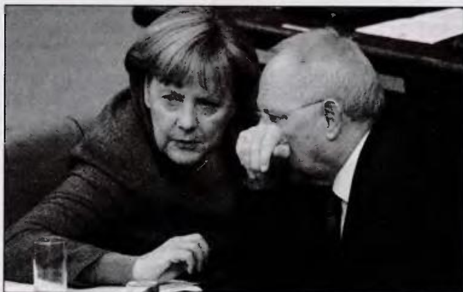
Το Βερολίνο για μια ακόμα φορά είναι ο μεγάλος πρωταγωνιστής της καταστροφής του τραπεζικού συστήματος μιας από τις ισχυρές χώρες της Ευρωπαϊκής Ένωσης

Ως ένα από τα πιο σημαντικά γεγονότα των επόμενων μηνών για την Ιταλία αλλά και για την ίδια τη συνοχή και