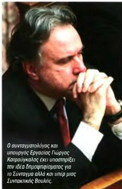
Ο συνταγματολόγος και υπουργός Εργασίας Γιώργος Κατρούγκαλος έχει υποστηρίξει την ιδέα δημοψηφίσματος για το Σύνταγμα αλλά και υπέρ μιας Συντακτικής Βουλής.

Το επιχείρημα αυτό όμως είναι νομικά και συνταγματικά ενδεές. Είναι δύσκολο να αποδειχθεί ότι η δράση ενός κόμματος και δημοκρατικού, δεν εξυπηρετεί το δημοκρατικό πολίτευμα, αφού μετέχει των εκλογών που είναι θεμελιακή αξία του ίδιου του δημοκρατικού πολιτεύματος! Επιπρόσθετα δεν υπάρχει κανένα στοιχείο για την «Χρυσή Αυγή» ότι ετοίμαζε ή ετοιμάζει «κατάλυση του πολιτεύματος». Στο άρθρο 12 του Συντάγματος αναφέρεται πως «οι Έλληνες