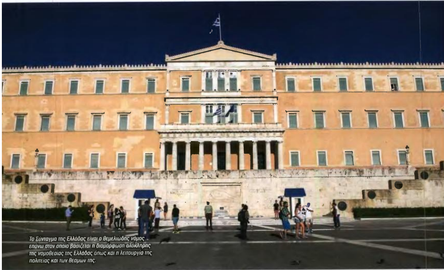
Το Σύνταγμα της Ελλάδας είναι ο θεμελιώδης νόμος επάνω στον οποίο βασίζεται η διαμόρφωση ολοκληρωτής της νομοθεσίας της Ελλάδας όπως και η λειτουργία της πολιτείας και των θεσμών της.

αναφέρεται ότι «η εκτελεστική εξουσία ορίζεται από τον ΠτΔ και την κυβέρνηση». Επομένως, σύμφωνα με το σκεπτικό, και βάσει των άρθρων 44 (δημοψήφισμα) και 110 (αναθεώρηση) δεν αποκλείεται η εφαρμογή της εκτελεστικής εξουσίας μέσω δημοψηφισμάτων, άρα και της αναθεωρητικής όντας μέρος της εκτελεστικής εξουσίας.