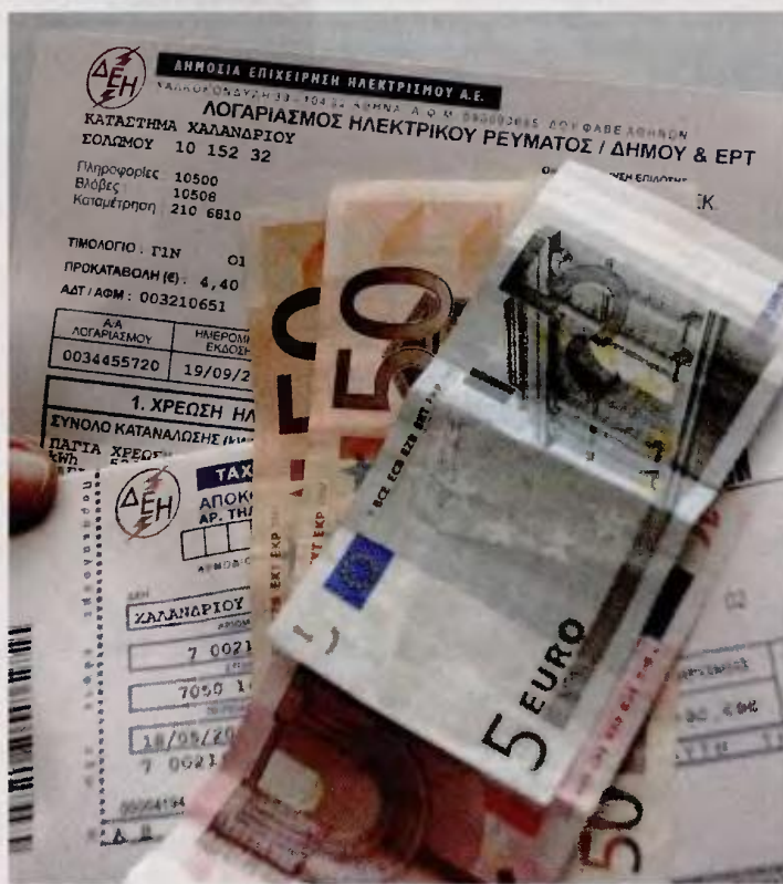
Οι ανεξόφλητες οφειλές προς τη ΔΕΗ από απλήρωτους λογαριασμούς ρεύματος έχουν εκτοξευθεί στα 2,5 δισ. ευρώ.

Οι ανεξόφλητες οφειλές προς τη ΔΕΗ από απλήρωτους λογαριασμούς ρεύματος, παρά τις προσπάθειες της διοίκησης για περιορισμό, έχουν εκτοξευθεί στα 2,5 δισ. ευρώ. Η ΡΑΕ αξιολογεί το πρόβλημα ως μείζον για το σύνολο της αγοράς, καθώς αυτό συνεπάγεται ελλείμματα στην αποπληρωμή των ποσών που αντιστοιχούν στο τέλος ΕΤΜΕ-ΑΡ (πρώην τέλος ΑΠΕ) καθώς και σε ελλείμματα προς τον ΔΕΔΔΗΕ και τον ΑΔΜΗΕ από ποσά που αντιστοιχούν στις αποκαλούμενες «ρυθμιστικές χρεώσεις» (τέλη δι-