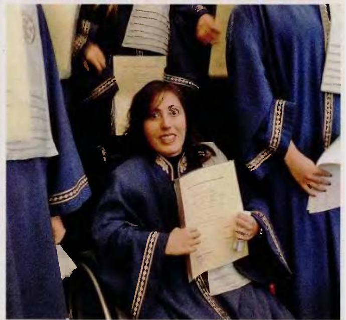
« Αν υπάρχει καλή θέληση και πραγματικά είσαι αποφασισμένος να αγαπάς τη ζωή, προσπαθείς γι' αυτή», λέει χαρακτηριστικά η Δανάν.