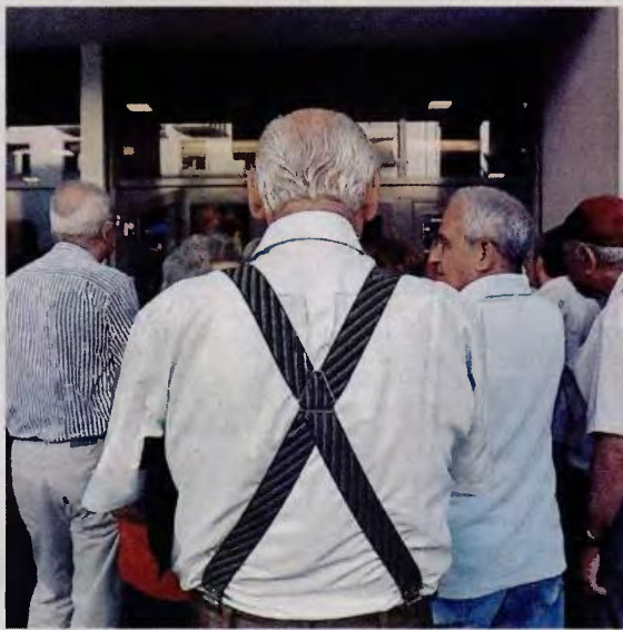
Στο στόχαστρο του υπουργείου Εργασίας μπαίνουν περίπου 50.000 συνταξιούχοι με υψηλές αποδοχές

Στις επικουρικές προβλέπονται μειώσεις έως 25% σε περισσότερες από 800.000 συντάξεις άνω των 170 ευρώ. Με τη μείωση των επικουρικών, αναμένεται να εξοικονομηθούν περίπου 250 εκατ. ευρώ ενώ τα υπόλοιπα 450 εκατ. ευρώ θα προέλθουν από την αύξηση της εργοδοτικής εισφοράς κατά μία ποσοστιαία μονάδα και της εισφοράς που θα πληρώσουν οι εργαζόμενοι κατά μισή μονάδα, κάτι που οδηγεί και σε αντίστοιχη μείωση των καθαρών αποδοχών για περίπου δύο εκατο-