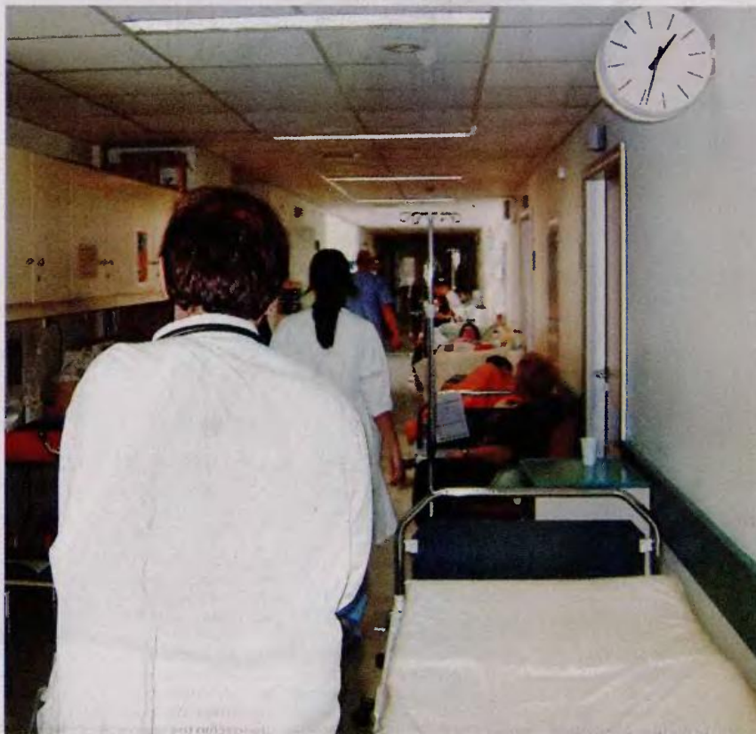
Αναμονές 8 ωρών στα επειγόντα του Αττικού Νοσοκομείου, ράντζα στους διαδρόμους και μόλις δύο νοσηλευτές για 45 ασθενείς συνθέτουν τη ζοφερή εικόνα που επικρατεί στον χώρο της Υγείας

Τα όσα συμβαίνουν στο Αττικό Νοσοκομείο δεν είναι παρά η κορυφή του παγόβουνου για τα όσα τραγικά συμβαίνουν στον ευρύτερο χώρο της Υγείας και τα οποία επιβεβαιώνει ο κ. Πλαγιανάκος: «Ο, τι συμβαίνει στο Αττικό γίνεται γνωστό στον περισσότερο κόσμο όταν η ανάγκη φέρει κάποιον στα Επειγόντα του Νοσοκομείου και χρειαστεί να περιμένει 8 ή 9 ώρες για να εξεταστεί στο Παθολογικό.