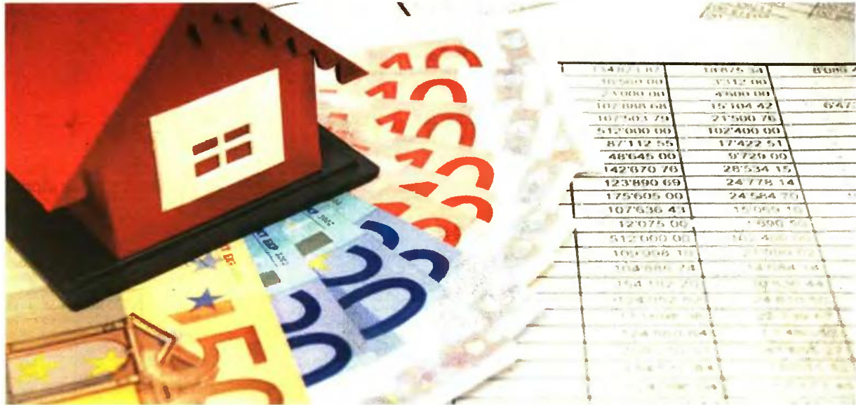
ΠΑΝΩ ΑΠΟ 100 ΔΙΣ. ΕΥΡΩ ΤΑ ΜΗ ΕΞΥΠΗΡΕΤΟΥΜΕΝΑ ΔΑΝΕΙΑ, ΤΑ ΟΠΟΙΑ ΑΠΟΤΕΛΟΥΝ ΑΓΚΑΒΙ ΓΙΑ ΤΗΝ ΑΞΙΟΛΟΓΗΣΗ