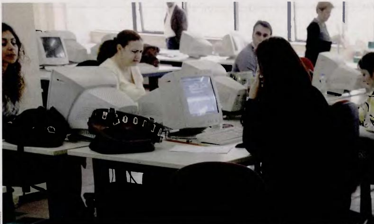
Η αλλαγή του συστήματός μας από σύστημα κοινωνικής ασφάλισης σε σύστημα κοινωνικής ασφάλισης, δηλαδή σύστημα ενιαίων, ομοιόμορφων ελάχιστων παροχών χρηματοδοτούμενων κατ' ουσίαν από τη φορολογία, δεν μπορεί να γίνει με νόμο.