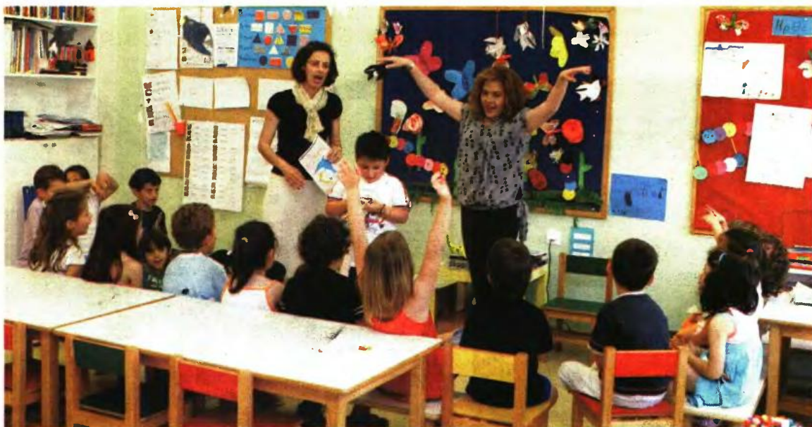
ΓΙΑ ΠΡΩΤΗ ΦΟΡΑ θα λειτουργήσει με τη νέα σχολική χρονιά ενιαίος τύπος ολοήμερου νηπιαγωγείου

Συνεπώς από τον Σεπτέμβριο το νηπιαγωγείο θα τελειώνει στις 13.00 και το δημοτικό στις 13.15. (Μέχρι σήμερα το νηπιαγωγείο τελειώνει στις 12.15 με 12.30 και το δημοτικό ανάλογα με τον τύπο-σχόλαγε στις 12.25 ή στις 13.15 ή στις 14.00). Σύμφωνα