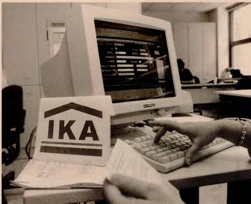
Η ηγεσία του υπουργείου Εργασίας διαπιστώνει καθημερινά ότι τα χρέη προς τα Ταμεία διογκώνονται ανεξέλεγκτα, αγγίζοντας πλέον τα 25 δισ. ευρώ.

Νέο σύστημα δόσεων και εξυπηρέτησης ληξιπρόθεσμων οφειλών προτίθεται να διαπραγματευτεί κατά τον νέο γύρο των συζητήσεων του Σεπτεμβρίου η ηγεσία του υπουργείου Εργασίας με τους εκπροσώπους των θεσμών, καθώς διαπιστώνει καθημερινά ότι τα χρέη προς τα Ταμεία αυξάνονται ανεξέλεγκτα, αγγίζοντας πλέον τα 25 δισ. ευρώ. Πρόκειται για μια ακόμη δύσκολη πτυχή της επικείμενης διαπραγμάτευσης του φθινοπώρου, που έρχεται να προστεθεί στα ανοικτά ζητήματα των εργασιακών αλλά και τα... υπόλοιπα του ασφαλιστικού. Οι εκπρόσωποι των θεσμών έχουν