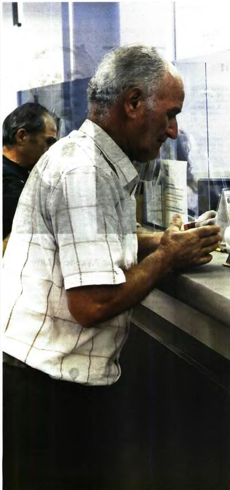
ΤΟ ΚΟΣΤΟΣ για τα αντισταθμιστικά μέτρα, τα οποία ισχύουν από την 1η Αυγούστου για όσους έχασαν ή έλαβαν μικρότερο ΕΚΑΣ, θα τεθεί στη διαπραγμάτευση με τους θεσμούς

Στο μεταξύ, ο Συνήγορος του Πολίτη έβαλε «φρένο» σε απόφαση του ΙΚΑ, με την οποία απαιτούσε από συνταξιούχο να επιστρέψει στο διπλάσιο τα ποσά του ΕΚΑΣ που του είχε πιστώσει το Ταμείο, χωρίς να έχει υποβληθεί αίτηση για τη λήψη του επιδόματος από τον ίδιο. Μετά την παρέμβαση του Συνήγορου, έγινε δεκτό ότι σε περιπτώσεις που η αχρεώστητη καταβολή του ΕΚΑΣ έγινε χωρίς να προηγηθεί αίτηση του συνταξιούχου, και εφόσον δεν συντρέχει κάποια παράλληλη ενέργεια από την οποία να προκύπτει δόλος εκ μέρους του, δεν θα πρέπει να παρακρατούνται στο διπλάσιο τα αχρεωστήτως καταβληθέντα ποσά.