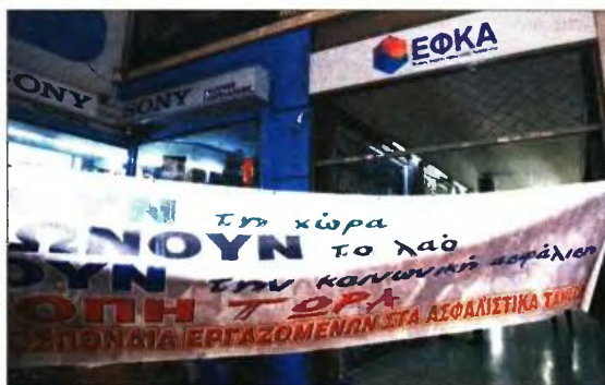
Από παλαιότερη διαμαρτυρία έξω από το κτίριο του ΕΦΚΑ

Το υπουργείο Εργασίας έθεσε το πρόβλημα στις πρόσφατες διαπραγματεύσεις με τους δανειστής, χωρίς όμως να βρεθεί λύση. Η ελληνική πλευρά πρότεινε να υπάρξει μέριμνα και για αυτούς τους ασφαλισμένους, μολονότι δεν είναι πλέον εργαζόμενοι, ώστε να ενταχθούν σε ρύθμιση οφειλών. Ωστόσο, η πρόταση προσέκρουσε στον «τοίχο» των πιστωτών και το θέμα αναμένεται να ξανασυζητηθεί στα τέλη του μήνα, στον επόμενο γύρο διαβουλεύσεων για την