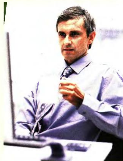
ΟΙ ΣΥΝΤΑΞΕΙΣ ΓΙΑ ΤΟΥΣ ΕΛΕΥΘΕΡΟΥΣ ΕΠΑΓΓΕΛΜΑΤΙΕΣ ΜΕ ΔΙΑΚΟΠΗ ΚΑΙ ΑΙΤΗΣΗ ΑΠΟ 13/5/2016

Αυτό όμως δεν θα ισχύσει για όσους πήραν ή έχουν ήδη προσωρινή σύνταξη, αλλά για όσους κάνουν αίτηση από εδώ και πέρα. Για να βγει, μάλιστα, το 80% ως προκαταβολή σύνταξης, η αίτηση θα πρέπει να είναι μόνον ηλεκτρονική. Όσοι την κάνουν χειρόγραφα θα πάρουν προσωρινή με το παλιό καθεστώς, δηλαδή το 50% του μισθού ή μηνιαίου εισοδήματος του τελευταίου έτους, με κίνδυνο να πέσουν στην παγίδα να επιστρέφουν συντάξεις αν η οριστική βγει κάτω από 768 ευρώ.