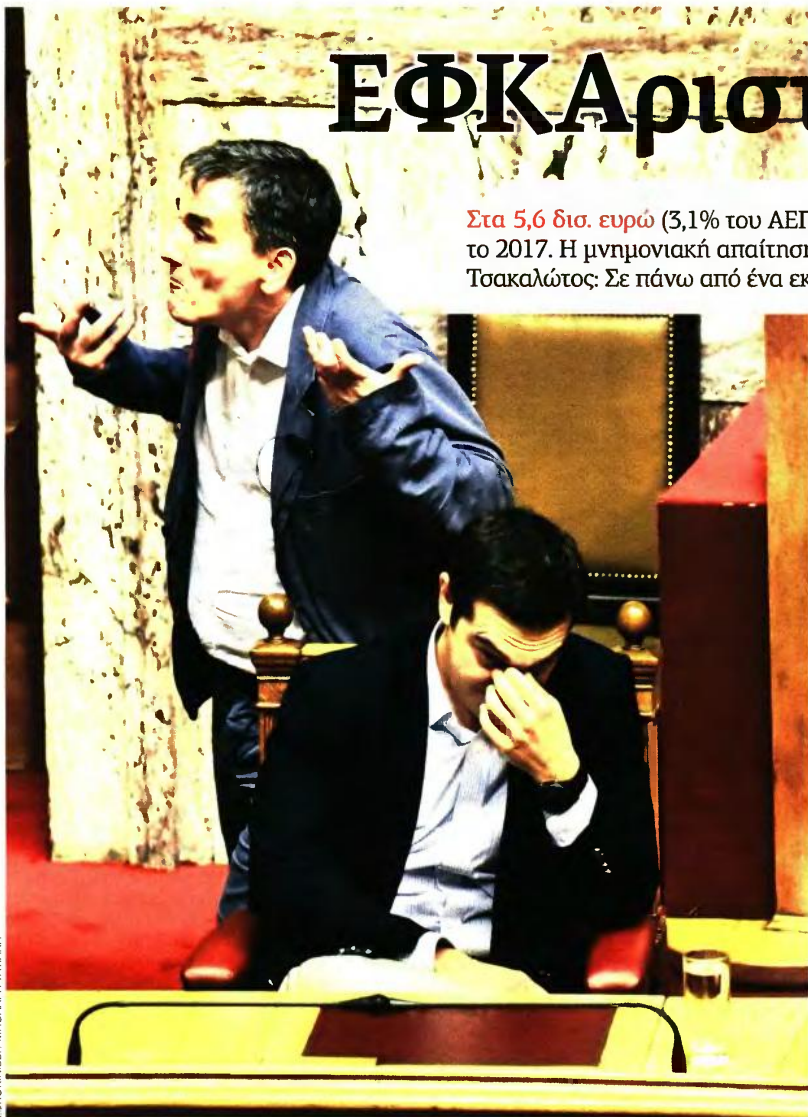
Μια «άσπρη τρύπα» που δεν περίμενε κανείς

Στα 5,6 δισ. ευρώ (3,1% του ΑΕΠ) θα διαμορφωθεί το πλεόνασμα για το 2017. Η μνημονιακή απαίτηση ήταν 3,1 δισ. ευρώ (1,75% του ΑΕΠ). Τσακαλώτος: Σε πάνω από ένα εκατομμύριο νοικοκυριά το «κοινωνικό μέρισμα»