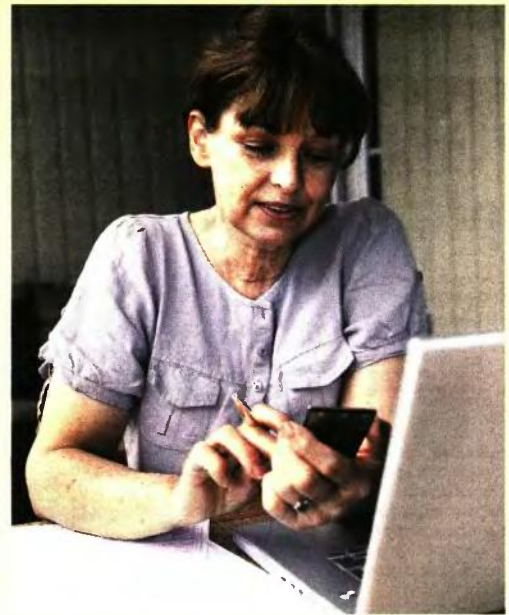
Οι νέες συντάξεις ΙΚΑ: Τι παίρνουν οι ασφαλισμένοι με αίτηση μετά τις 13/5/2016 και τι θα έπαιρναν

7 Με αποδοχές 1.600 ευρώ (μέσος όρος από το 2002 ως το 2017) και με 37 χρόνια ασφάλισης, η σύνταξη είναι 979 ευρώ μικτά και 920 ευρώ μετά το 6% για ασθένεια. Με τον παλιό τρόπο ο ίδιος ασφαλισμένος θα έπαιρνε 1.207 ευρώ μικτά και 1.135 ευρώ μετά την εισφορά 6%. Έχει δηλαδή μείωση 214 ευρώ ή κατά 18,9%.