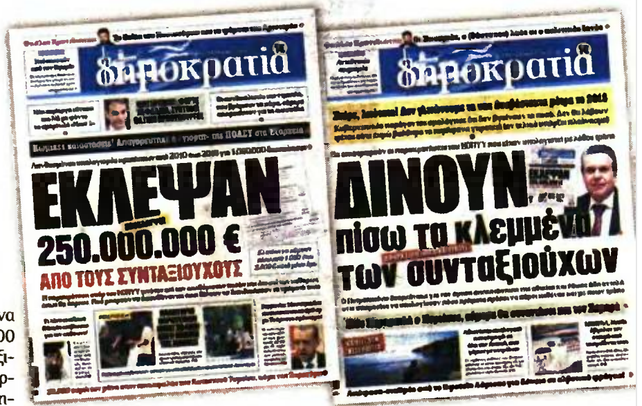
Τα αποκαλυπτικά πρωτοσέλιδα της «δημοκρατίας» στις 29 Ιουνίου (αριστερά) και τις 14 Σεπτεμβρίου του 2017

Σύμφωνα με έγγραφο της Γεν. Δ/νσης Απονομής Συντάξεων του υπουργείου Εργασίας (αρ.1375934/19-10-2017), επισημαίνεται ότι η επιστροφή θα πραγματοποιηθεί σε μια δόση και θα αφορά συνταξιούχους από όλα τα ασφαλιστικά ταμεία, που πλήρωσαν μεγαλύτερες εισφορές υγειονομικής περιθαλψής για το χρονικό διάστημα από 1/1/2012 μέχρι 30/6/2016. Συνολικά, είχε υπολογιστεί ότι οφείλονται περίπου