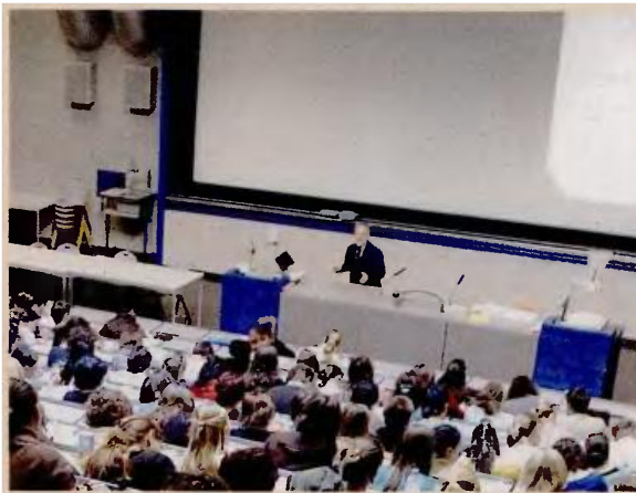
Η εκπαίδευση αποτελεί τη δεύτερη μεγάλη κατηγορία όπου δραστηριοποιούνται οι κοινωνικές επιχειρήσεις.