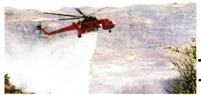
Απαραίτητη προϋπόθεση για τους υποψηφίους είναι να έχουν πτητική εμπειρία 2.000 ωρών

Απαιτείται πτυχίο Νομικής, Πολιτικών Επιστημών, Διεθνών και Ευρωπαϊκών Σπουδών. ■ «Επικοινωνιολόγος». Απαιτείται πτυχίο Επικοινωνίας και ΜΜΕ ή συναφές πτυχίο Πανεπιστημίου ή Ελληνικού Ανοικτού Πανεπιστημίου (ΕΑΠ) ή Προγραμμάτων Σπουδών Επιλογής (ΠΣΣ). Για τη συμμετοχή στη διαδικασία επιλογής απαιτείται η αποστολή ταχυδρομικά με συστημένη επιστολή και την ένδειξη «για τη διαδικασία επιλογής πέντε (5) Εμπειρογνομόνων» στο υπουργείο Εξωτερικών (ΣΤ1 Διεύθυνση Προσωπικού και Διοικητικής Οργάνωσης, Ακαδημίας 1, 10671, Αθήνα, γραφείο 208, τηλ.: 210-3681139). Οι υποψήφιοι μπορούν να προμηθευθούν την αίτηση συμμετοχής από την ιστοσελίδα του υπουργείου Εξωτερικών ( www.mfa.gr/dinatotites-epaggelmatikisstadiodromias-sto-ypex/klados-empirognomonon ).