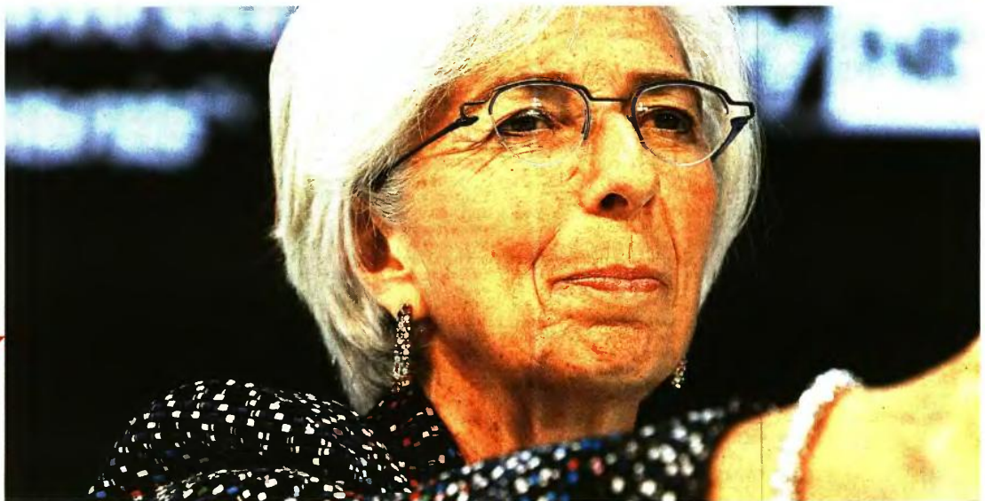
Η Κριστίν Λαγκάρντ και το Διεθνές Νομισματικό Ταμείο αμφισβητούν ως υπεραισιόδοξο το κυβερνητικό αφήγημα περί εκτόξευσης της ελληνικής οικονομίας

Σήμα κινδύνου για πρόσθετα μέτρα 2,7 δισ. ευρώ από το ΔΝΤ προκειμένου να επιτευχθεί ο στόχος του πρωτογενούς πλεονάσματος 3,5% το 2018!