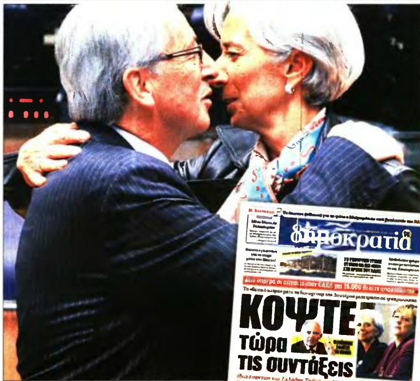
Η Κριστίν Λαγκαγκάντ και ο Ζαν Κλοντ Γιούνγκερ. Δυσόινες οι εκτιμήσεις ΔΝΤ και Κομισιόν. Δεξιά: Το πρωτοσέλιδο της «δημοκρατίας» στις 23/2/2017

Πάντως, το Ταμείο σημειώνει ότι οι εκτιμήσεις του