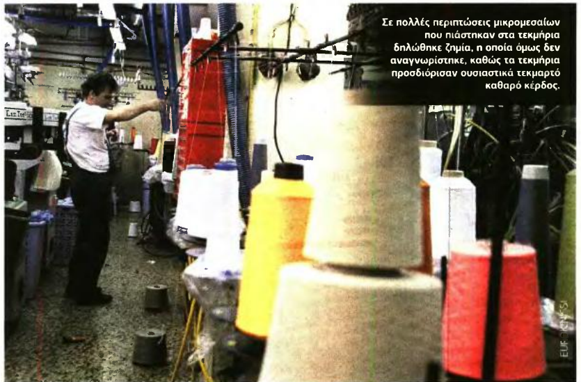
Σε πολλές περιπτώσεις μικρομεσαίων που πιάστηκαν στα τεκμήρια δηλώθηκε ζήμια, η οποία όμως δεν αναγνωρίστηκε, καθώς τα τεκμήρια προσδιόρισαν ουσιαστικά τεκμαρτό καθαρό κέρδος.

ανήλθε σε 2,74 δισ. ευρώ περίπου. Στο ποσό αυτό οι υπηρεσίες της ΑΑΔΕ πρόσθεσαν άλλα 2 δισ. ευρώ, λόγω των τεκμηρίων, με αποτέλεσμα οι συγκεκριμένοι μισθωτοί να φορολογηθούν για συνολικό ποσό εισοδήματος 4,74 δισ. ευρώ, το οποίο είναι προσαυξημένο κατά 73% σε σχέση με το συνολικό δηλωθέν εισόδημά τους.