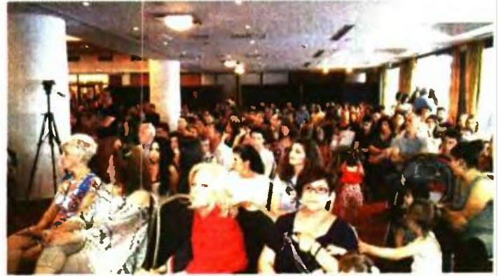
● Πλήθος κόσμου στη χθεσινή εκδήλωση στο Ξενία

Δραματική μείωση έως και 50% του αριθμού τους μέσα στην κρίση