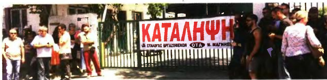
Προειδοποιητική χαρακτηριστική η χθεσινή ολιγόωρη κατάληψη στο αμαξοστάσιο του Δήμου Βόλου

170 συμβασιούχοι στη Μαγνησία κινδυνεύουν να μείνουν στο δρόμο