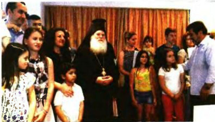
● Ο Γέροντας Εφραίμ με πολύτεκνες οικογένειες