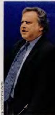
Να ανοίξουν και επισήμως σήμερα τα χαρτιά τους οι θεσμοί, αναμένει ο Γιώργος Κατρούγκαλος.

Εξίσου ανυποχώρητος εμφανίζεται και σε σχέση με το εσωτερικό μέτωπο, καθώς οποιαδήποτε παρέμβαση στη λογική της μείωσης των εισφορών για τους ελεύθερους επαγγελματίες, τους αγρότες και τους επιστήμονες, κάτω του 20%, θα πετούσε αυτόματα εκτός στόχου τις προβλέψεις για τα έσοδα του νέου ασφαλιστικού φορέα.