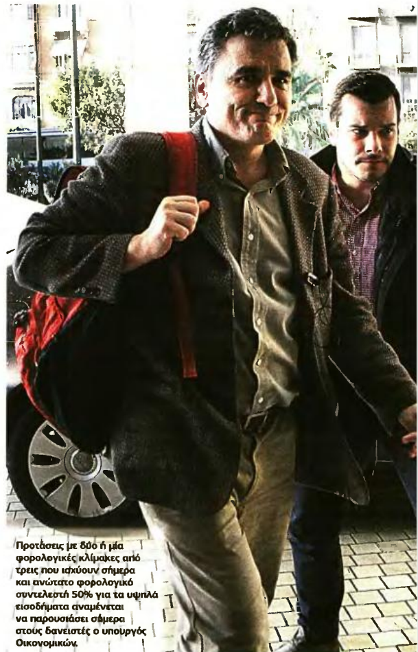
Προτάσεις με δύο ή μία φορολογικές κλίμακες από τρεις που ισχύουν σήμερα και ανώτατο φορολογικό συντελεστή 50% για τα υψηλά εισοδήματα αναμένεται να παρουσιαστεί σήμερα στους δανειστές ο υπουργός Οικονομικών.

γ) Τη φορολόγηση των εισοδημάτων από επιχειρηματικές και γεωργικές δραστηριότητες σε μία κλίμακα, στην οποία είτε θα ισχύει συντελεστής 26% από το πρώτο ευρώ, οπότε θα επέλθει πλήρης φορολογική εξομολογία των αγροτών με τους ασκούντες ατομικές