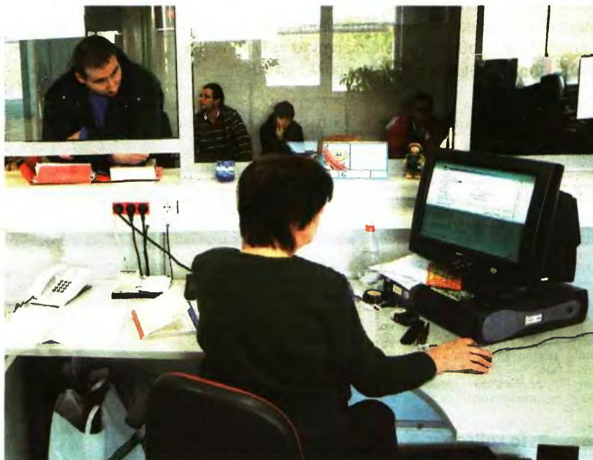
Οι αλλαγές θα πλήξουν κυρίως όσους εμφανίζουν εισοδήματα άνω των 30.000 ευρώ

Για την πλειονότητα των ελεύθερων επαγγελματιών - και συγκεκριμένα για όσους αποκτούν εισοδήματα έως 32.000 ευρώ - θα προκύψουν φοροελαφρύνσεις, καθώς ο συντελεστής 26% που επιβαλλόταν στους έχοντες εισοδήματα έως 50.000 ευρώ μειώνεται στο 22% για έχοντες εισοδήματα έως 20.000 ευρώ.