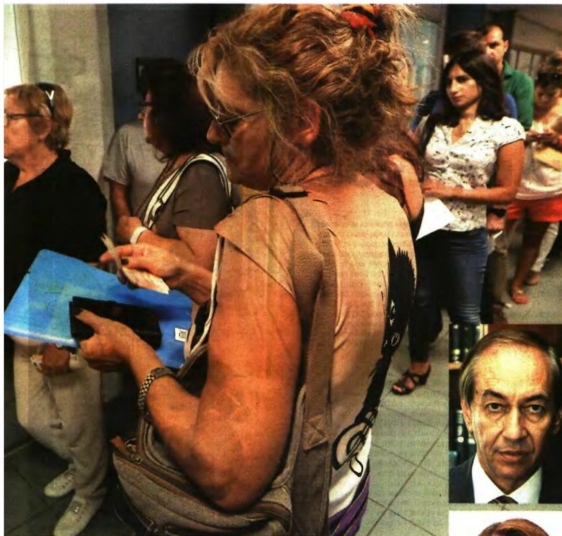
(1993), που διαθέτουν παράλληλα μπλοκ παροχής υπηρεσιών, είναι οι μεγάλοι χαμένοι του νέου συστήματος