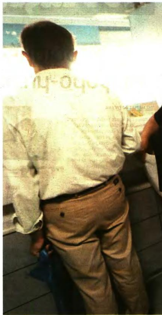
Οι μισθωτοί με σύμβαση εξαρτημένης εργασίας, νέοι ασφαλισμένοι (μετά την

2 «Παλαιοί ασφαλισμένοι» σήμερα στην 3η κατηγορία ΟΑΕΕ πληρώνουν 314,99 ευρώ. Χάνουν αν από 1/1/2017 δηλώνουν εισόδημα από 2.500 ευρώ (εισφορά 318 ευρώ) και πάνω.