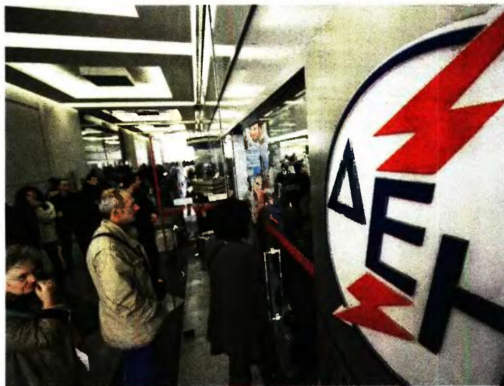
Παρέμβαση της ΕΚΠΟΙΖΩ αποτυπώνει την αγανάκτηση των καταναλωτών για τις άδικες χρεώσεις στους λογαριασμούς ρεύματος.

Οι πολίτες δεν μπορούν πια να πληρώνουν για χρεώσεις τις οποίες δεν έχουν καταναλώσει