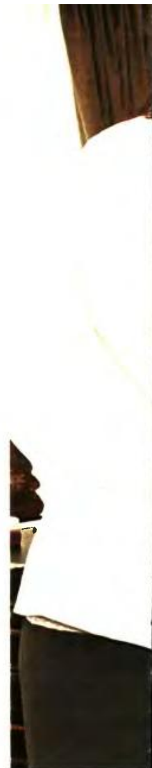
Η Νίκη Κεραμέως τον υπουργό Παιδείας Κώστα Γαβρόγλου κατά τη χθεσινή τους συνάντηση

«Είχα τη χαρά να συναντηθώ με την κυρία Κεραμέως, υπεύθυνη του τομέα Παιδείας της Νέας Δημοκρατίας. Αιτιντήθηκαν όλα, ανεξάρτητα αν συμφωνεί κάποιος με τις απαντήσεις» ανέφερε από την πλευρά του ο κ. Γαβρόγλου, για να καταλήξει ότι στόχος της κυβέρνησης «είναι η αναβάθμιση του Λυκείου: Δύσκολη και περιπλοκή συζήτηση».