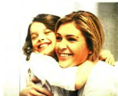
Σύνταξη μητέρων ασφαλισμένων στα Ειδικά Ταμεία πριν από το 1993

10 ΕΤΑΑ-γυναίκες. Όσες έχουν 35ετία ως το 2011 συνταξιοδοτούνται με βάση την ηλικία των 58. Με ηλικία 58 το 2016, σύνταξη στα 59, με ηλικία 58 το 2019, σύνταξη στα 60,6. Με 35ετία το 2012, το όριο καθορίζεται από την ηλικία των 59. Με ηλικία 59 το 2017, σύνταξη στα 60,2, με ηλικία 59 το 2020, σύνταξη στα 61,3 κ.ο.κ. Οι γυναίκες με 25 έτη στο ΣΤΜΕΔΕ και στο Ταμείο Νομικών ή με 21,6 στο ΤΣΑΥ μέχρι 31/12/2010 βγαίνουν στη σύνταξη με το όριο ηλικίας που θα ισχύει όταν γίνουν 60 ετών. Αν το 60ό έτος συμπληρώνεται τέλος του 2015, η έξοδος είναι στα 60,11 ετών. Για το 2016 το όριο ηλικίας ανεβαίνει στα 61,9, το 2017 πάει στα 62,8, το 2018 στα 63,6, το 2019 στα 64,5, το 2020 είναι 65,3, και από 2022 στα 67. ■