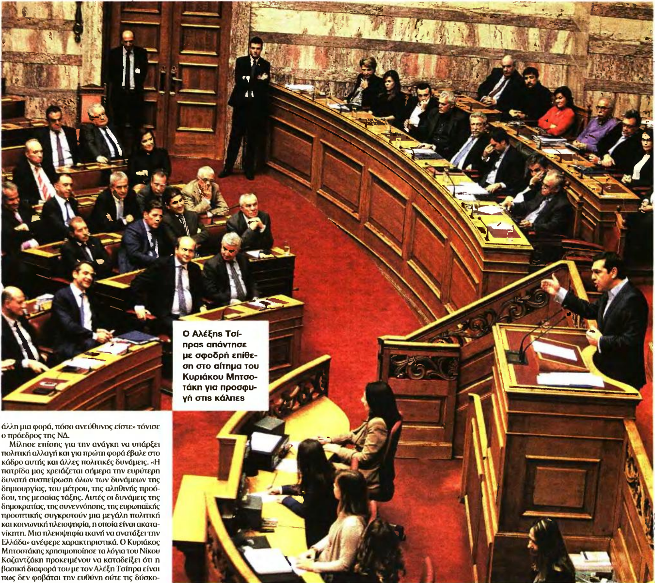
Ο Αλέξης Τσίπρας απάντησε με σφοδρή επίθεση στο αίτημα του Κυριάκου Μητσοτάκη για προσφυγή στις κάλπες

άλλη μια φορά, τόσο ανεύθιμος είστε» τόνισε ο πρόεδρος της ΝΔ.