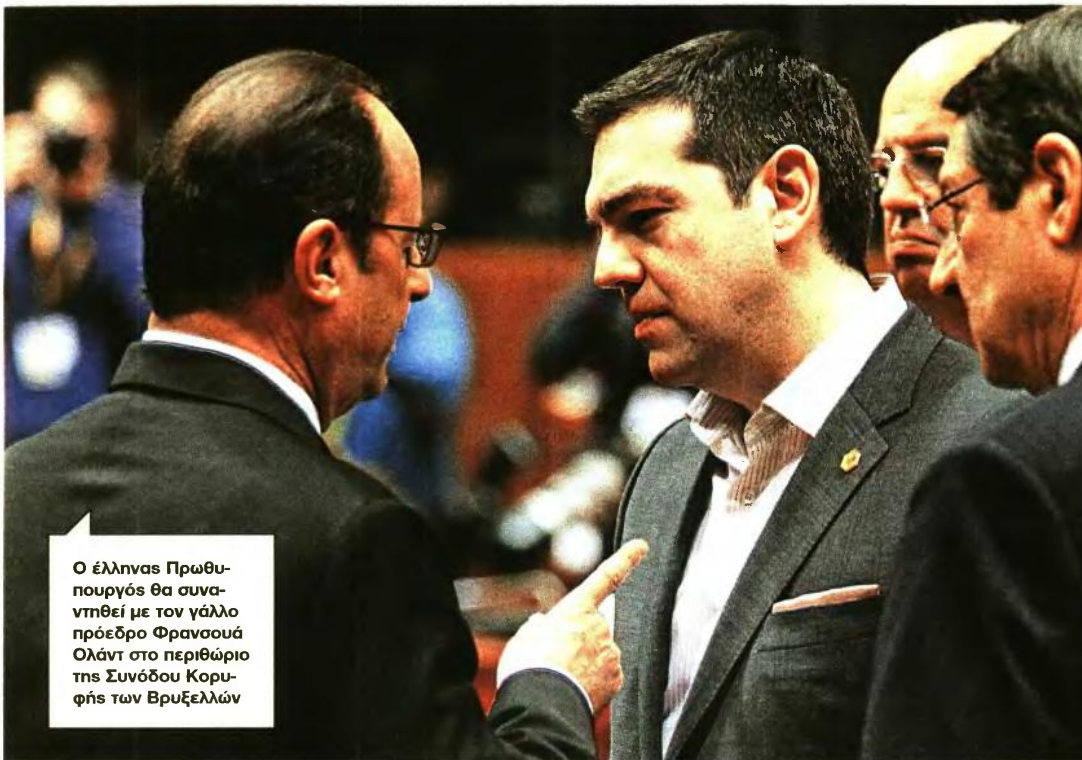
Ο έλληνας Πρωθυπουργός θα συναντηθεί με τον γάλλο πρόεδρο Φρανσουά Ολάντ στο περιθώριο της Συνόδου Κορυφής των Βρυξελλών