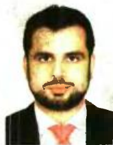
Γράφει ο Διονύσιος Ρίζος

2017. Μάλιστα φαίνεται πως πλέον δεν θα αποστέλλονται σημειώματα με τις εισφορές, αλλά θα εκδίδεται ηλεκτρονική ταυτότητα πληρωμής στα πρότυπα των ΔΟΥ. Μετά τον πρώτο υπολογισμό με το εισόδημα του 2015 θα υπάρξει νέος