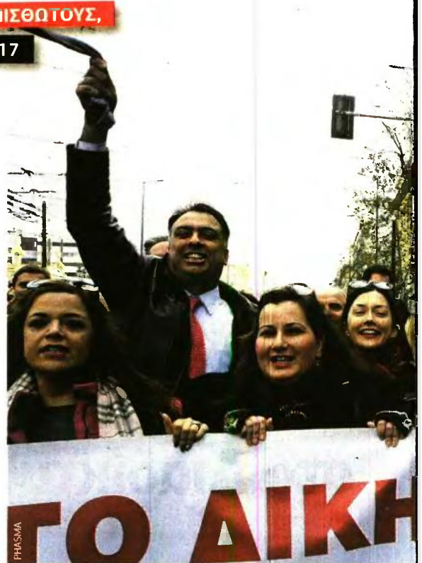
ΠΟΣΟ ΕΠΙΒΑΡΥΝΟΝΤΑΙ ΟΙ ΔΗΜΟΣΙΟΙ ΥΠΑΛΛΗΛΟΙ ΜΕ ΤΟ

● Υπάλληλος με πεντάκι ΑΕΙ (Π.Ε. κατηγορία) και 35 έτη υπηρεσίας πληρώνει σήμερα εισφορές επί των αποδοχών που θα υπολογιστούν για τη σύνταξη και είναι 1.912 ευρώ (1.666 ευρώ βασικός, 140,8 επίδομα και 105 ευρώ επίδομα θέσης). Αυτές οι αποδοχές είχαν καθοριστεί με το μισθολόγιο που ήταν σε ισχύ ως τον Οκτώβριο του 2011, και δεν περιελάμβαναν άλλα επιδόματα ή αποζημιώσεις (υπερρωρές κ.ά.). Επί των 1.912 ευρώ η εισφορά κύριας σύνταξης που καταβάλλει ο υπάλληλος με 35ετία είναι 128 ευρώ το μήνα. Από 1/1/2017