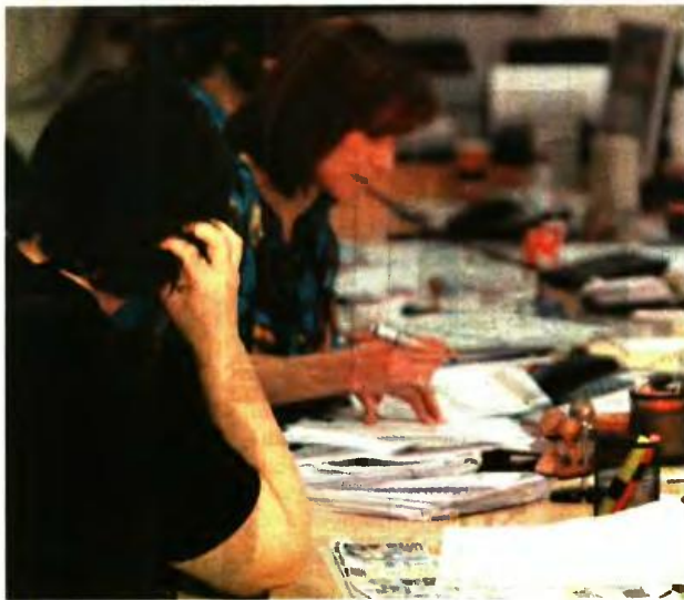
Χαμένοι είναι οι υπάλληλοι κατηγοριών ΠΕ και ΤΕ, ειδικά όσοι έχουν και αρκετά χρόνια υπηρεσίας.

Ετσι η βάση υπολογισμού ήταν ο βασικός μισθός του 2011 με προσθήκη μιας διαφοράς επιδόματος (140,80€), ενώ αν ο υπάλληλος ελάμβανε επίδομα θέσης ευθύνης, η κράτηση γινόταν και επί του εν λόγω επιδόματος. «Δεν γίνονταν κρατήσεις στο σύνολο των αποδοκών, εξαιρούνταν δηλαδή τα επι-