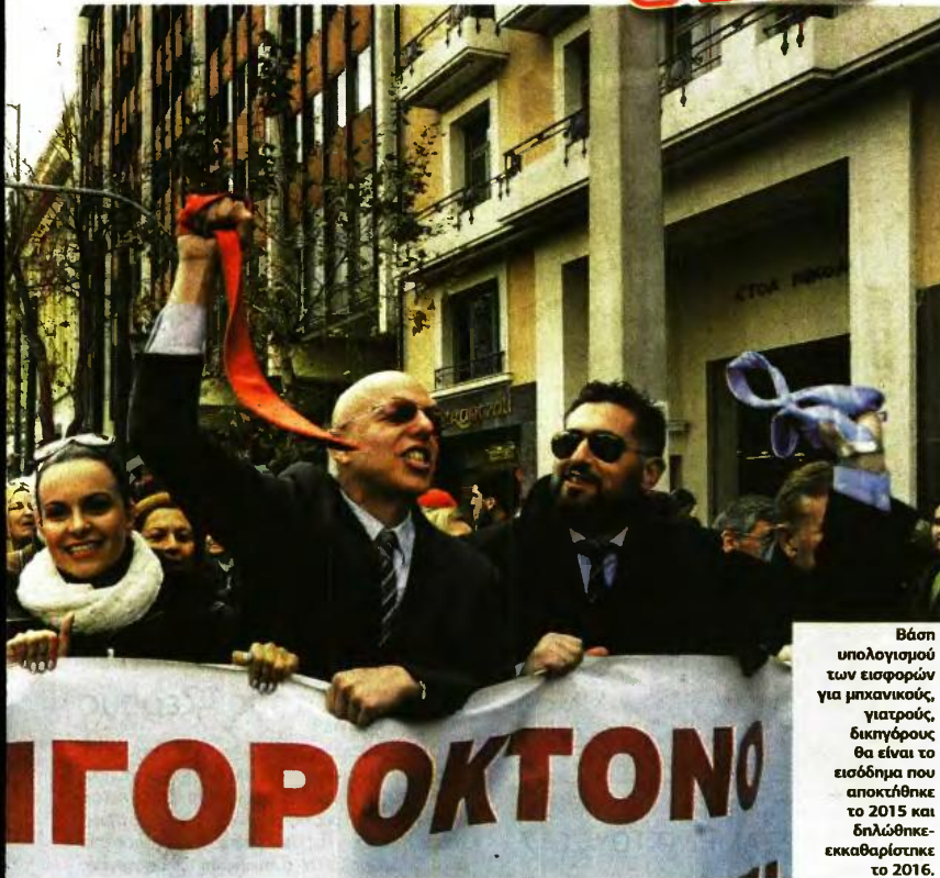
Βάση υπολογισμού των εισφορών για μηχανικούς, γιατρούς, δικηγόρους θα είναι το εισόδημα που αποκλήθηκε το 2015 και δηλώθηκε εκκαθαρίστηκε το 2016.