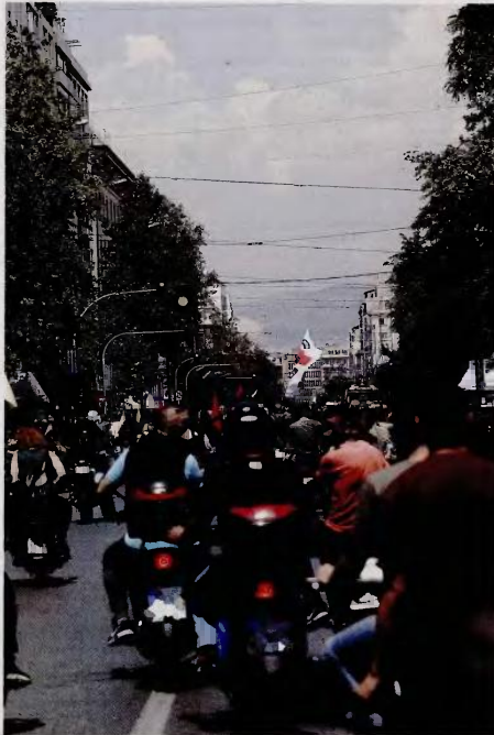
Παλιότερη μελέτη του ΣΕΠΕ είχε αναδείξει ότι ένας στους τέσσερις διανομείς φαγητού υπέστη τουλάχιστον μία φορά ατύχημα στη δουλειά του.

Η εξίσωση θα ήταν μάλλον αδύνατη να βγει, αν η κρίση δεν περιόριζε και τις παραγγελίες, που θεωρούνται «ατασθαλίες» και αρμόζουν