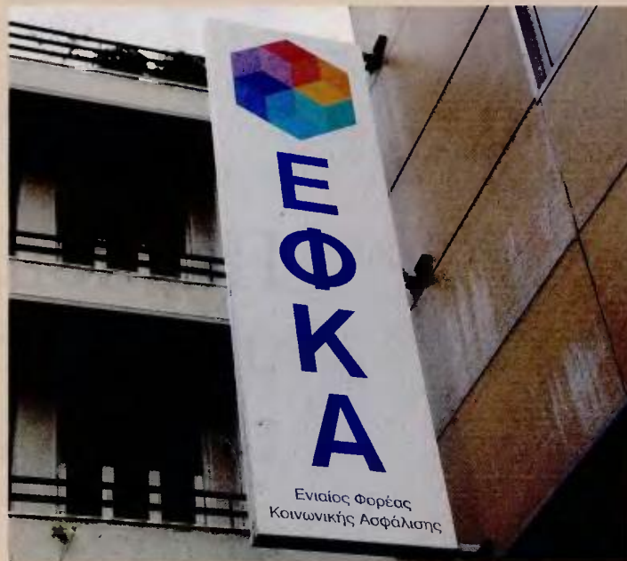
Από την έναρξη λειτουργίας του ηλεκτρονικού συστήματος μητρώου του ΕΦΚΑ, χιλιάδες ασφαλισμένοι βρέθηκαν αντιμέτωποι με λάθη στα στοιχεία τους.

Να σημειωθεί ότι από την έναρξη λειτουργίας του ηλεκτρονικού συστήματος μητρώου του ΕΦΚΑ, χιλιάδες ασφαλισμένοι βρέθηκαν αντιμέτωποι με λάθη στα στοιχεία τους. Αλλά ήταν απλά, όπως μια διαφορά στη διεύθυνση κατοικίας ή στο τηλέφωνο επικοινωνίας, άλλα ήταν πιο σύνθετα, με αποτέλεσμα να μεγαλώνει η ταλαιπωρία, καθώς αριθμοί μητρώου εξαφανίστηκαν και κατά συνέπεια χάθηκαν ένσημα. Προβλήματα υπήρξαν και με τα μητρώα των αυτοαπασχολούμενων, με αποτέλεσμα πολλοί συνταξιούχοι να λάβουν ειδοποιητήριο για εισφορές, ενώ επαγγελματίες ακόμη περιμένουν τα δικά τους ειδοποιητήρια. Σύμφωνα με πληροφορίες, στο μητρώο ΕΦΚΑ δεν μεταφέρθηκαν τα στοιχεία από την πιο πρόσφατη ενημέρωση των ανά