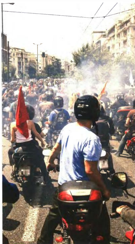
Εκατοντάδες διανομείς κρατώντας σημαίες πλημμύρισαν τους δρόμους της Αθήνας

Από εκεί ξεκίνησε η μεγάλη μηχανοκίνητη πορεία (400-500 δικύκλα στην κορύφωσή της) με κατεύθυνση το υπουργείο Εργασίας. Όταν έφτασαν, έστησαν πανό που έγραφαν «Από τον αγώνα δρόμου... στον δρόμο του αγώνα» κ.ά., φώναξαν συνθήματα «Δεν είμαστε παπά, δεν είμαστε παιδιά, δεν είμαστε αναλώσιμοι», παρέδωσαν υπόμνημα με τα αιτήματά τους, ενώ αντιπροσωπεία του σωματείου συναντήθηκε με τον γενικό γραμματέα