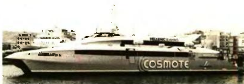
Το Flying cat 4 θα συνδέσει τη Θεσσαλονίκη με τα νησιά