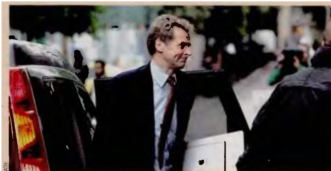
Το ΔΝΤ δεν έχει συμφωνήσει με τη διατύπωση συγκεκριμένης ημερομηνίας για επαναφορά ρυθμίσεων που έχουν «παγώσει», υποστήριξε ο κ. Τόμσεν.