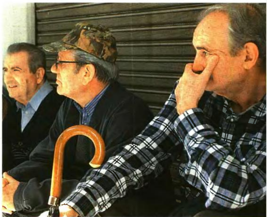
Στους μεγάλους χαμένους και οι δικαιούχοι του ΕΚΑΣ, λόγω των νέων εισοδηματικών κριτηρίων. Ειδικό εκμύνη πως το επίδομα χάνουν φέτος περί τα 120.000 άτομα

Οι δημόσιοι υπάλληλοι που άνοιξαν την πόρτα της εξόδου με λίγα χρόνια υπηρεσίας και αντίστοιχα μικρό «καρτοφυλάκιο» εισφορών θα είναι οι μεγάλοι χαμένοι από το γενναίο «ψαλίδι» 32,47% που έρχεται για το μέρισμα 280.000 συνταξιούχων δημοσίων υπαλλήλων. Ο νέος τύπος υπολογισμού που προωθείται θα είναι ενιαίος για όλους και θα καταργεί τις δυο ταχύτι-