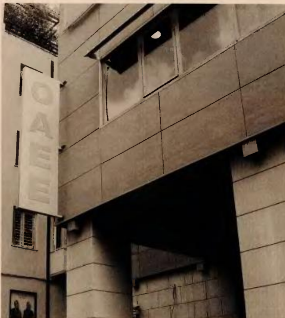
Για τους παλαιούς (έως το 1992) ασφαλισμένους του ΟΑΕΕ το κατώτατο όριο σύνταξης είναι στα 473,4 ευρώ και για τους νέους στα 486,29 ευρώ.

Καθώς, βέβαια, το ταμείο των ελευθέρων επαγγελματιών δίνει κατά κανόνα υψηλότερες από τα κατώτατα όρια συντάξεις, στην εγκύκλιο διευκρινίζεται ότι οι μειώσεις αφορούν κυρίως δύο κατηγορίες ασφαλισμένων: όσοι συνταξιοδοτούνται στα 62 με 15ετή συντάξιμο χρόνο καθώς και όσοι συνταξιοδοτούνται στο 50 ή 55ο έτος ηλικίας, με 20ετή συντάξιμο χρόνο για μητέρες ή κήρους πατέρες ανίκανων για κάθε βιοποριστική εργασία παιδιών, για μειωμένη ή πλήρη σύνταξη αντίστοιχα. Οι συγκεκριμένοι ασφαλισμένοι θα λαμβά-