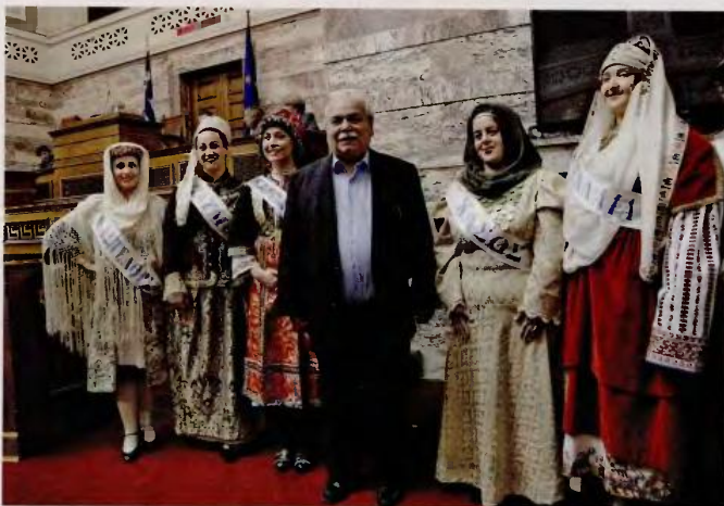
Από τη σεμνή τελετή στη Βουλή για την επέτειο της ενωμάζιωσης της Δωδεκανήσου στον εθνικό κορμό. Ξεκινώντας από αριστερά, διακρίνω το Καστελλόριζο, την Πάμο, την Κίρραθο, την Ελλάδα (με κοστούμι, πουκιάμο, χωρίς γραβάτα - είναι η νέα εθνική ενδυμασία), την Κάσο και... Τι πράξη η καρδέλα της επόμενης κοπέλας, διακρίνω ένα άλωρα, ένα λάβδα, ένα ίατα και ένα όλφα. Τα Ιμαλία; Με ανήκουν τα Ιμαλία στη Δωδεκάνησο; Μπράβο μας! (Όπως απαράδεκτο, πάντως, ότι στη φωτογραφία δεν περιλαμβάνεται η Κάλυμνος.)

Όλα τα παραπάνω, όμως, είναι δευτερεύοντα. Το πρωτεύον ήταν, είναι και θα είναι το μαλλί της Σίας. Χθες, λοιπόν, εμφανίσθηκε με νέα coupe. Εσχάστε το στυλ Μέδοισα, με το οποίο τη γνωρίσαμε και την αγαπήσαμε. Τώρα ισκάνει λίγο τα μπροστινά (όσο γίνεται, εντελώς είναι αδύνατον) και όλα μαζί τα κάνει bouffant. Της πάνε, δεν μπορώ να πω. Τιποτε όμως δεν είναι