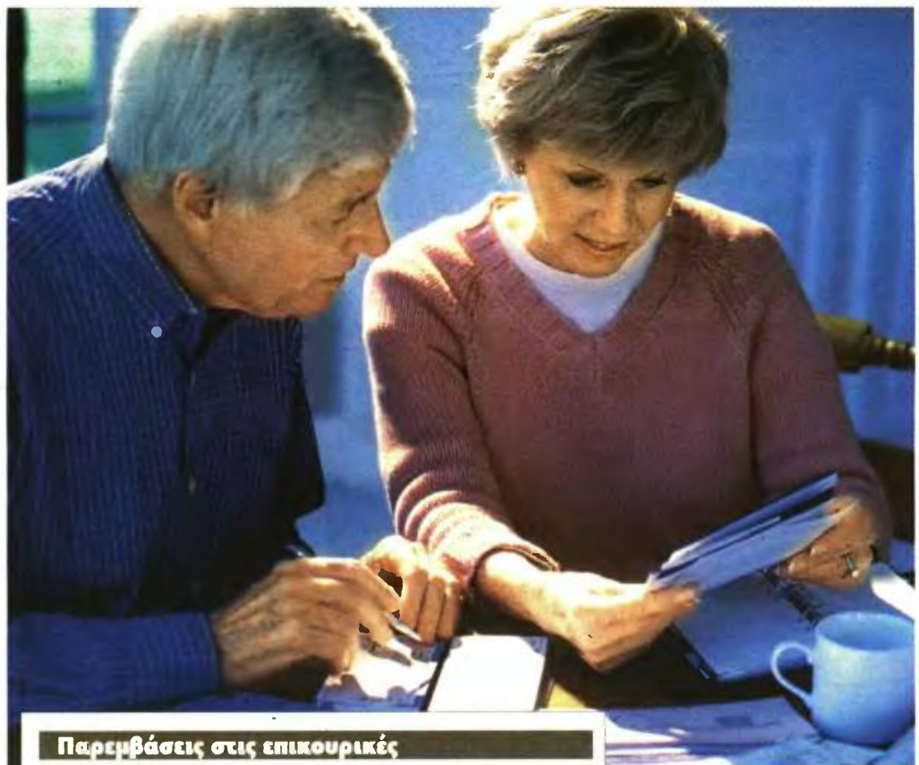
Παρεμβάσεις στις επικουρικές

Μεγάλοι χαμένοι είναι 86.000 που παίρνουν πάνω από 400 ευρώ, καθώς αναμένεται να υποστούν απώλειες τουλάχιστον 11%. Το βα-