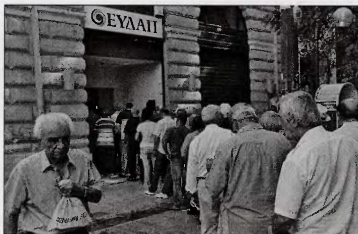
Οι αιτήσεις ένταξης στο νέο Έκτακτο Ειδικό Τιμολόγιο της ΕΥΔΑΠ έχουν ξεκινήσει από την 1η Ιουλίου και θα ολοκληρωθούν στο τέλος του μηνός

1/7/2017 και εφεξής και θα αφορούν σε καταναλώσεις που θα πραγματοποιηθούν από 1/5/2017 και μετά και σε κάθε περίπτωση από την έκδοση του επόμενου λογαριασμού από την ημερομηνία υποβολής της αίτησης από τον δικαιούχο.