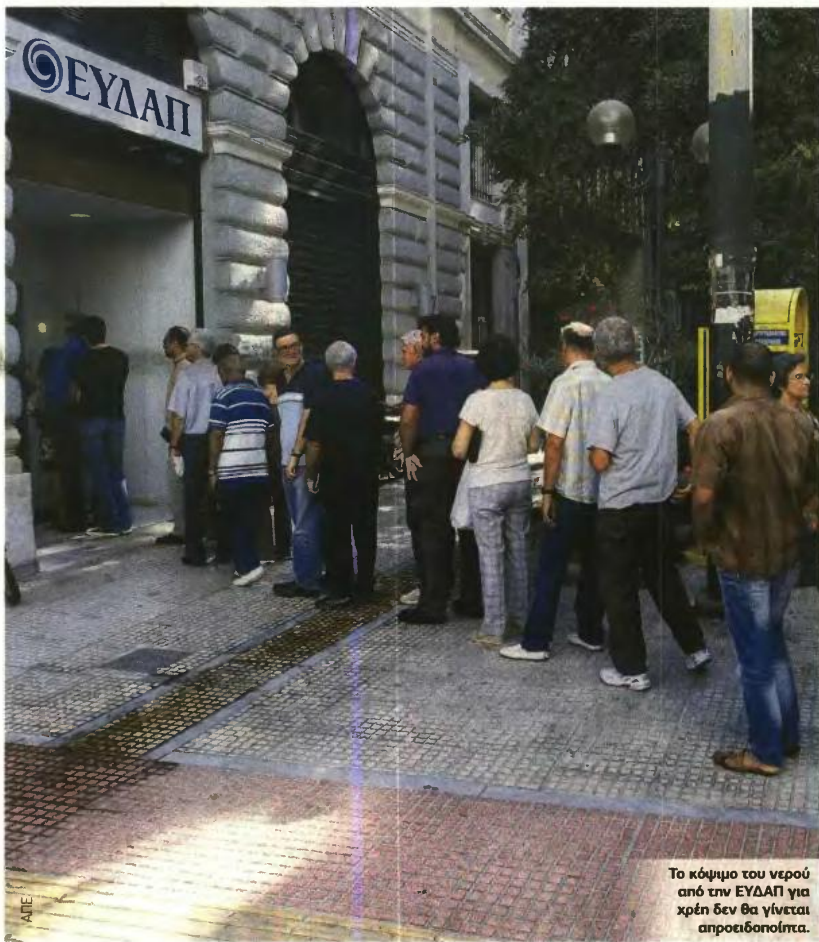
Το κόψιμο του νερού από την ΕΥΔΑΠ για χρέη δεν θα γίνεται απροειδοποίητα.