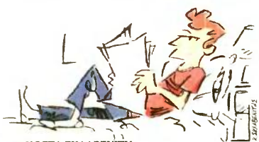
ΤΟΥ ΚΩΣΤΑ ΣΚΛΑΒΕΝΙΤΗ