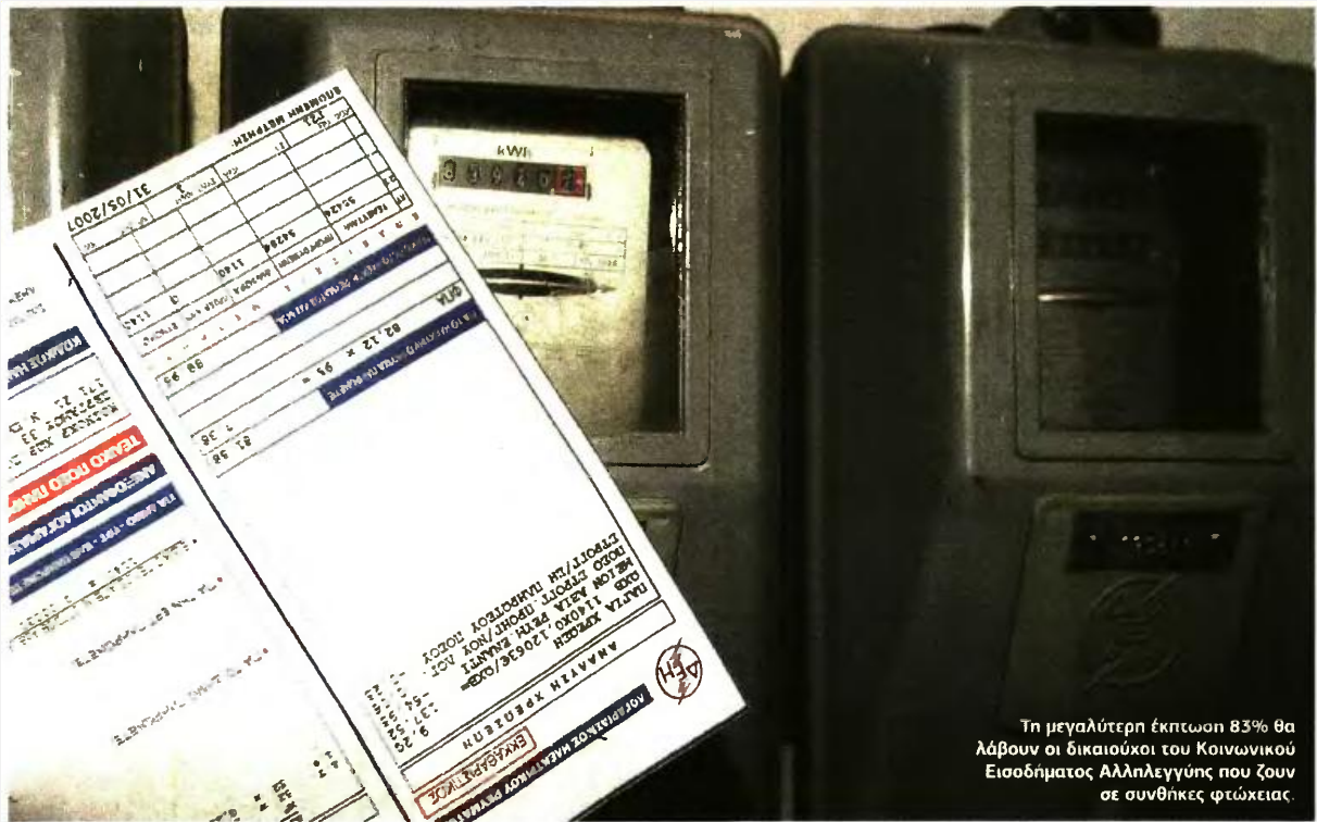
Τη μεγαλύτερη έκπτωση 83% θα λάβουν οι δικαιούχοι του Κοινωνικού Εισοδήματος Αλληλεγγύης που ζουν σε συνθήκες φτώχειας.

ΑΠΟΚΛΕΙΣΜΟΙ ΧΙΛΙΑΔΩΝ ΝΟΙΚΟΚΥΡΙΩΝ ΜΕ... ΕΙΣΟΔΗΜΑΤΙΚΑ ΚΡΙΤΗΡΙΑ