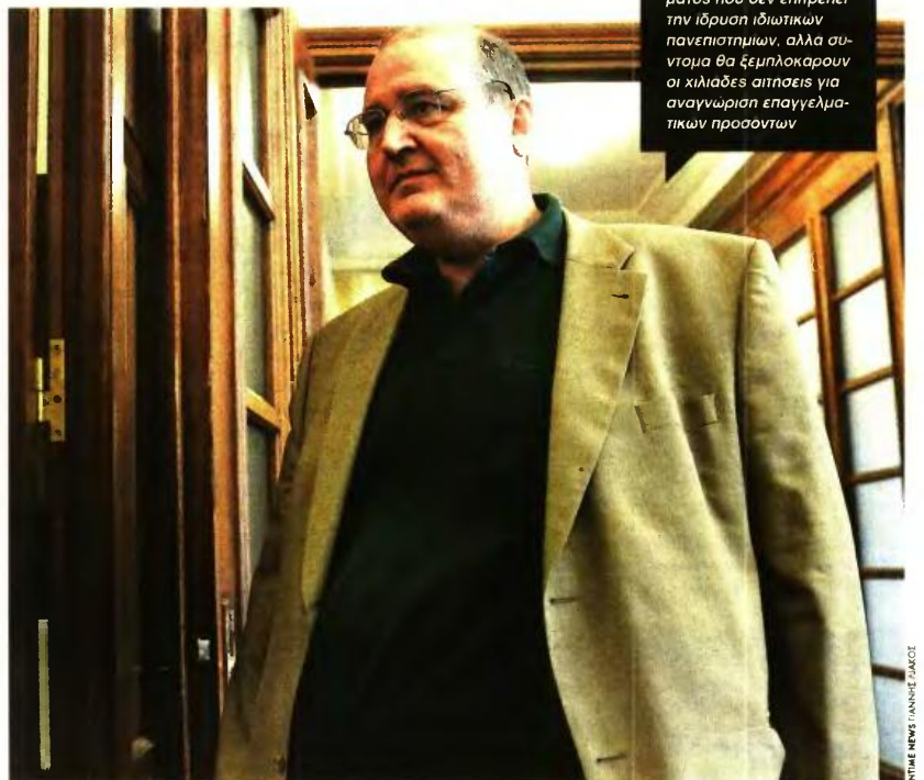
Ο υπουργός Παιδείας Νίκος Φίλης ξεκαθάρισε ότι δεν θα καταργηθεί το άρθρο 16 του Συντάγματος που δεν επιτρέπει την ίδρυση ιδιωτικών πανεπιστημίων, αλλά σύντομα θα ξεμπελοκάρουν οι χιλιάδες αιτήσεις για αναγνώριση επαγγελματικών προσόντων

Για τα Θρησκευτικά είπε ότι δεν μελετάται κατάργηση του μαθήματος, αλλά δεν πρέπει να είναι κατήχηση και ομολογιακό μάθημα αλλά μάθημα