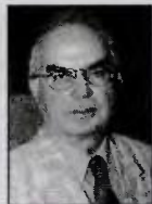
Του Δημήτρη Λ. Στεργίου

Κ ΛΑΙΝΕ ΟΙ ΧΗΡΕΣ, κλαίνε και οι παντρεμένες». Αυτή τη θυμόσοφη ελληνική ρήση μου θύμισε η προτροπή του προέδρου της Τουρκίας, κατά την τελετή εγκαινίων ενός νέου παραπήματος του Συνδέσμου των Γυναικών και της Δημοκρατίας, να κάνουν οι γυναίκες της χώρας του τουλάχιστον τρία παιδιά, τονίζοντας εύστοχα ότι «οι ισχυρές οικογένειες οδηγούν σε ισχυρά έθνη» και επισημαίνοντας ότι «η ζωή μιας γυναίκας είναι απελής εάν δεν αποκτήσει απογόνους».