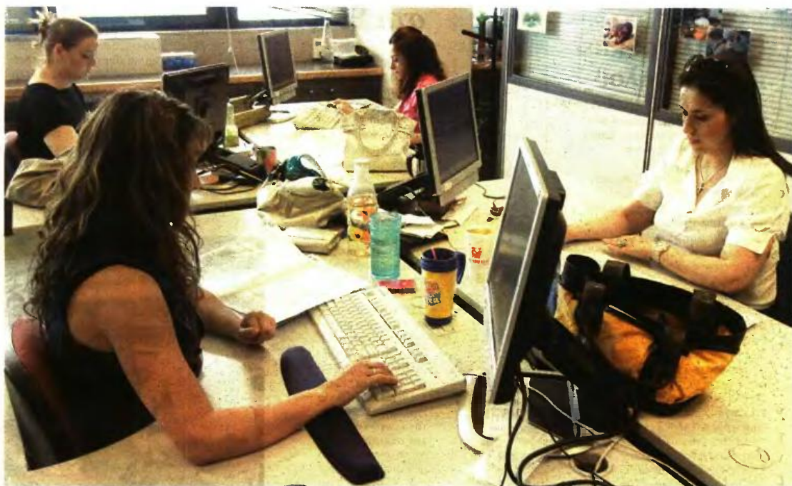
ΤΟ ΑΠΟΤΕΛΕΣΜΑ των συλλογικών διαπραγματεύσεων στο Δημόσιο θα επηρεάσει το σύνολο του μόνιμου προσωπικού στον στενό δημόσιο τομέα και στα ΝΠΔΔ, τους δικαστικούς λειτουργούς και τους εργαζομένους στους ΟΤΑ

Το αποτέλεσμα των συλλογικών διαπραγματεύσεων μεταξύ κράτους και δημοσίων υπαλλήλων θα επηρεάσει το σύνολο του μόνιμου προσώ-