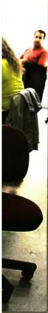
όμως κλείνει τα 61 της ανεβαίνει στα αποχωρήσουν από

2012 ηλικίας καθορίζεται ο 58ο έτος. Όσοι γίνονται 60 και 3 μήνες του 2018. Αν η εξαγοράσουν τόσα 37, τότε παίρνουν