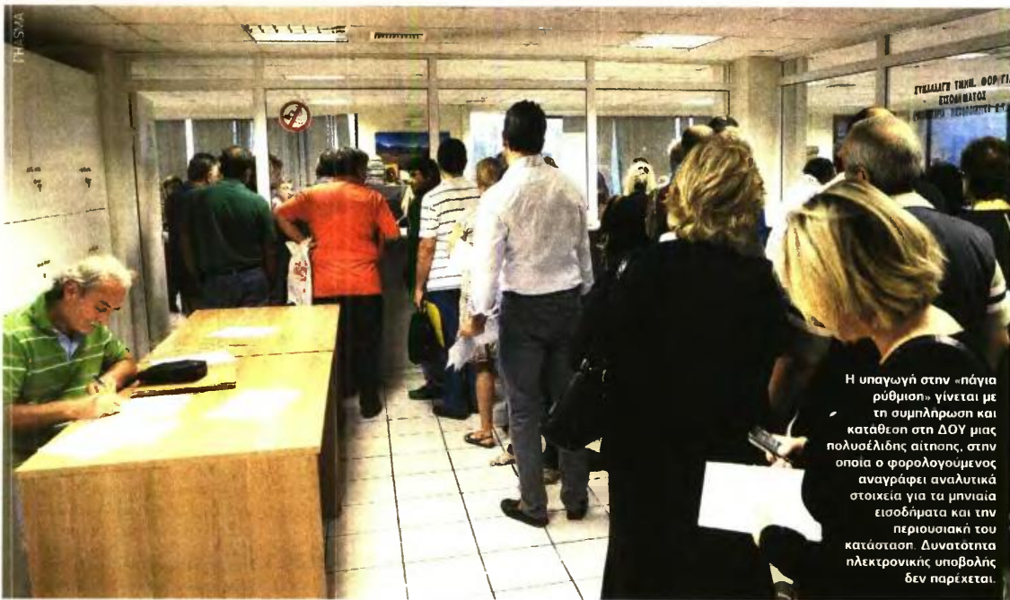
Η υπαγωγή στην «πάγια ρύθμιση» γίνεται με τη συμπλήρωση και κατάθεση στη ΔΟΥ μιας πολυσέλιδης αίτησης, στην οποία ο φορολογούμενος αναγράφει αναλυτικά στοιχεία για τα μηνιαία εισοδήματα και την περιουσιακή του κατάσταση. Δυνατότητα ηλεκτρονικής υποβολής δεν παρέχεται.