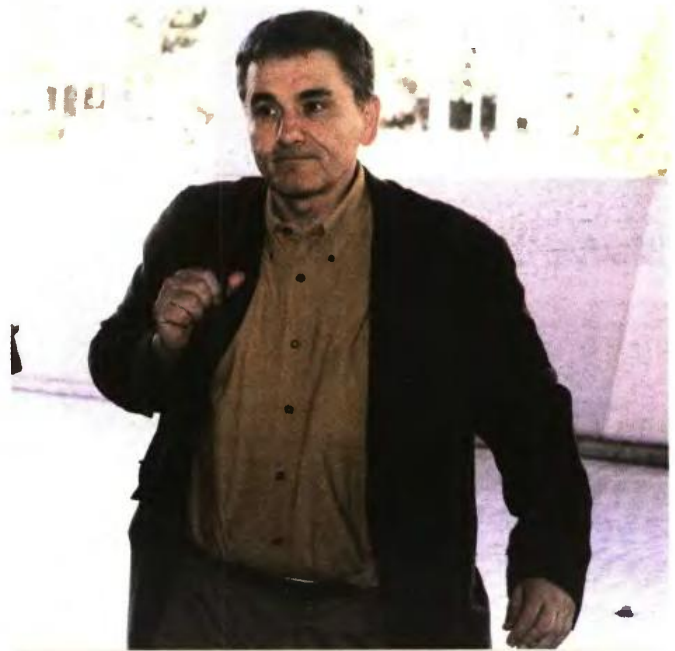
Η κατάργηση της αυτοτελούς φορολόγησης κάθε πηγής εισοδήματος και η ένταξη όλων των εισοδημάτων σε μία κλίμακα που προωθεί ο υπ. Οικονομικών θα προκαλέσει σημαντικές αυξήσεις φορολογικών επιβαρύνσεων για μεγάλο αριθμό φορολογούμενων.

Σε κάθε περίπτωση, όμως, η κατάργηση της