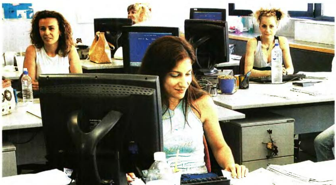
ΤΟ ΚΥΒΕΡΝΗΤΙΚΟ ΣΥΜΒΟΥΛΙΟ επιβεβαίωσε ότι τα νέα οργανογράμματα θα πρέπει να έχουν ολοκληρωθεί εντός του 2016 προκειμένου να γίνει ο προγραμματισμός των μετακινήσεων, των αποσπάσεων και των νέων προσλήψεων για την επόμενη χρονιά

Στον διαγωνισμό θα μπορούν να συμμετέχουν δημόσιοι υπάλληλοι οι οποίοι ανταποκρίνονται στα τυπικά προσόντα των θέσεων. Οι υποψήφιοι θα μοριοδοτούνται μέσω ΑΣΕΠ και στη νέα θέση θα μετακινείται ο υπάλ-