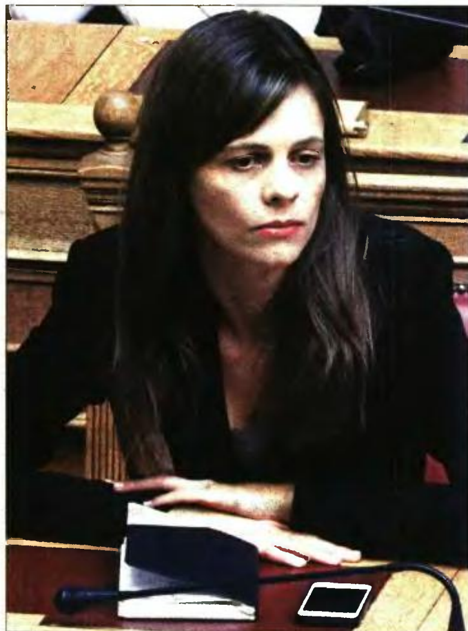
Η υπουργός Εργασίας Εφη Αχτσιόγλου

Παράλληλα, ορθάνοιχτα παραμένουν τα μεγάλα «αγκάθια» της διαπραγμάτευσης, δηλαδή τα εργασιακά, τα δημοσιονομικά και οι δημοπρασίες ηλεκτρικής ενέργειας. Η τηλεδιάσκεψη