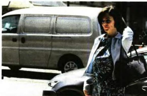
Ο υπ. Οικονομικών δέχθηκε χωρίς αντίδραση τα περισσότερα από τα νέα φοροεπιπρακτικά μέτρα που περιλαμβάνονταν στο προσχέδιο του νέου αναθεωρημένου Μνημονίου που του παρέδωσαν οι επικεφαλής των θεσμών.

ΕΛΕΥΘΕΡΟΣ ΤΥΠΟΣ ΔΕΥΤΕΡΑ 28 ΝΟΕΜΒΡΙΟΥ 2016