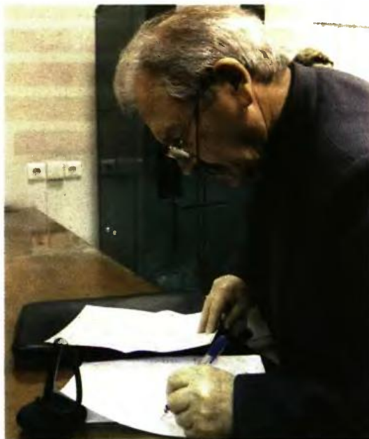
ΟΙ ΣΥΝΤΑΞΙΟΥΧΟΙ με επικουρική πάνω από 500 ευρώ τον μήνα είναι οι μεγάλοι χαμένοι του νέου συστήματος

Τα «ψαλίδια» μετρούν από τις συντάξεις Ιουνίου. Όσοι μπήκαν στο πρώτο «πακέτο» του επανυπολογισμού (11 πρώην Ταμεία, 311.680 συνταξιούχοι) και στο φάσμα των μειώσεων τον Αύγουστο, πρέπει να επι-