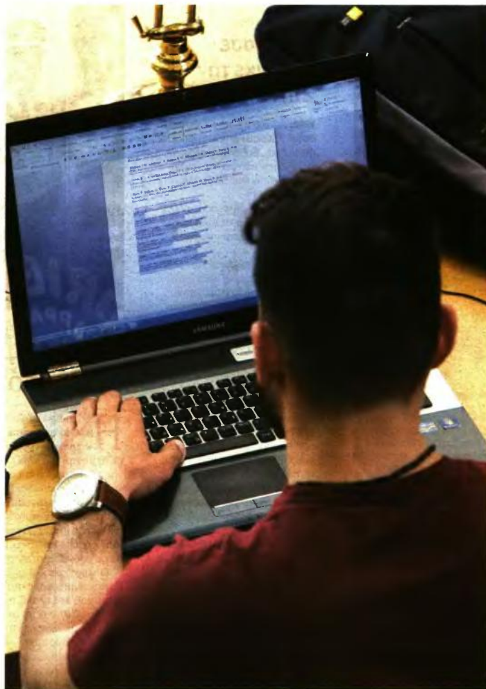
ΟΙ ΑΙΤΗΣΕΙΣ των ενδιαφερόμενων φοιτητών θα πρέπει να κατατεθούν στην ιστοσελίδα του υπουργείου Παιδείας ( www.minedu.gov.gr ) στην ειδική εφαρμογή για τις μετεγγραφές

Για την εισοδό τους στην ηλεκτρονική εφαρμογή οι αιτούντες θα χρησιμοποιήσουν το όνομα χρήστη (username) και τον κωδικό (password) που τους χορηγήθηκε από τη Γραμματεία της Σχολής ή