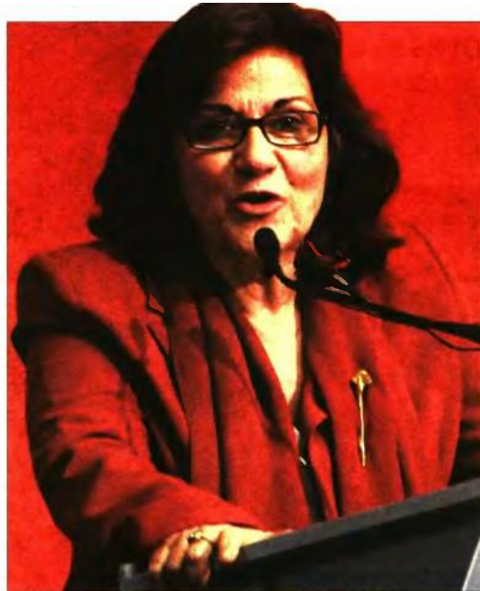
Η αναπληρώτρια υπουργός Κοινωνικής Αλληλεγγύης Θεανώ Φωτίου

Επιβεβαιώνει ότι επικείμενες παρεμβάσεις που θα αλλάξουν «τον προνοιακό χάρτη» η αναπληρώτρια υπουργός Θεανώ Φωτίου