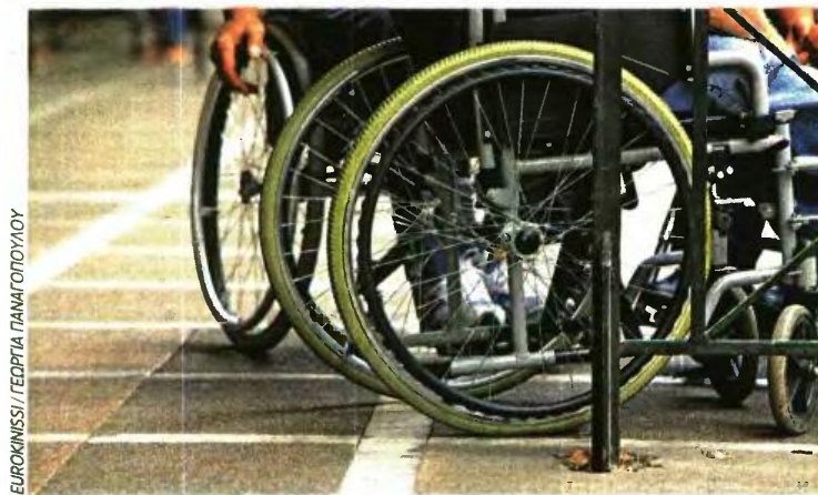
ΕΥΡΟΚΙΝΗΣΗ / ΓΕΩΡΓΙΑ ΠΑΠΑΓΕΩΡΓΙΟΥ