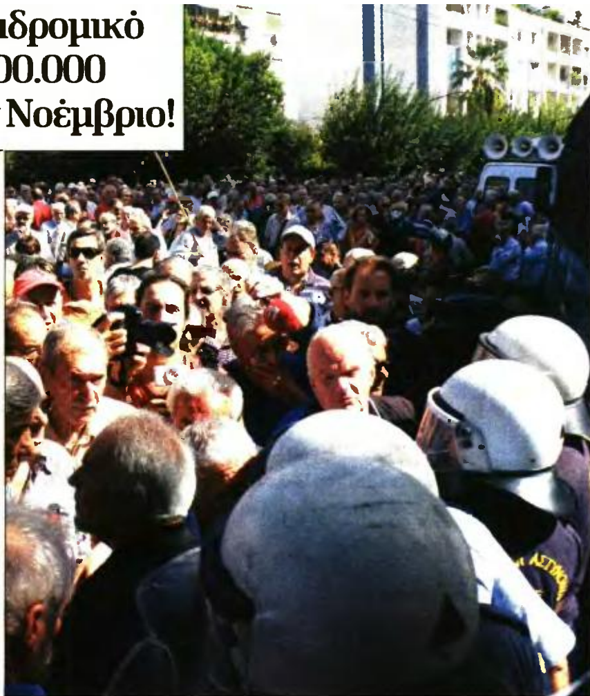
Διαδήλωση συνταξιούχων κατά των περικοπών στις συντάξεις

Συγκεκριμένα, τους επόμενους δύο μήνες θα έρθουν -μαζί με τις αντίστοιχες μηνιαίες καταβολές- τρεις δόσεις αναδρομικών κρατήσεων για 250.000 επικουρικές συντάξεις, 260.000 διπλές κύριες συντάξεις και μία δόση αναδρομικών κρατήσεων για 290.000 μερίσματα συνταξιούχων του Δημοσίου, μια και τα μερίσματα καταβάλλονται πλέον κάθε τρίμηνο και η επόμενη καταβο-