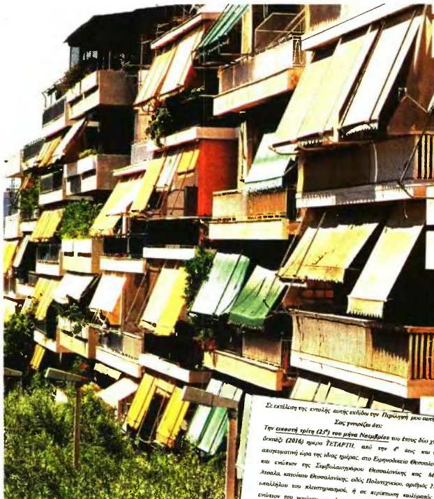
Εγγραφο για πλειστηριασμό με ημερομηνία 23 Νοεμβρίου 2016

Εκάλη έχουν βγει μέχρι τώρα σε πλειστηριασμό. Γιατί εμείς μπορούμε με στοιχεία να αποδείξουμε ότι καμιά βίλα στο Πανόραμα δεν έχει βγει, αλλά αντίθετα δεκάδες είναι μέχρι τώρα τα λαϊκά σπίτια των 40, 60 και 80 τ.μ. που βγαίνουν στο σφυρί στο Ειρηνοδικείο Θεσσαλονίκης και εκατοντάδες ακόμη έρχονται στο επόμενο διάστημα από τον Εύοσμο, το Καλοχώρι και τις γειτονίες της πόλης μας.