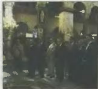
Στιγμιότυπο από τη θεία λειτουργία