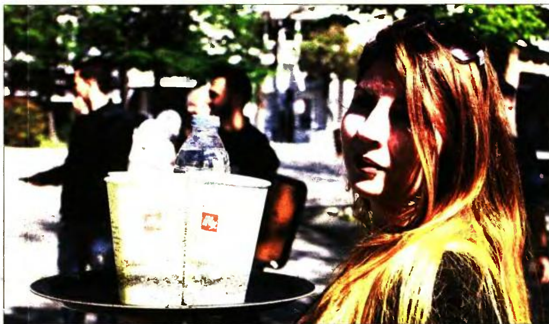
Σε 427,35 ευρώ ανέρχεται ο μέσος μικτός μισθός για μερική απασχόληση στον ιδιωτικό τομέα

Σε σύγκριση με έναν μήνα νωρίτερα, δηλαδή τον Ιούλιο του 2016, παρότι ο αριθμός των ασφαλισμένων αυξήθηκε στο σύνολο των επιχειρήσεων κατά 5,55%, ο μέσος μισθός μειώθηκε στις κοινές επιχει-