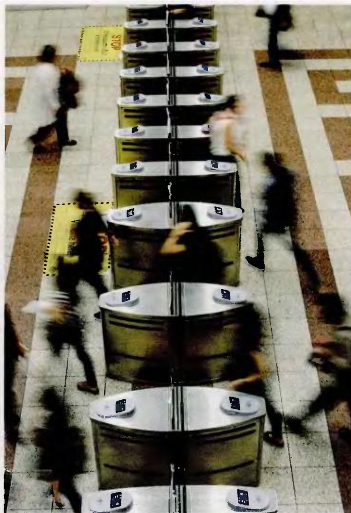
Μέχρι σήμερα έχουν κλείσει οι μπάρες σε έξι από τους 60 σταθμούς.

Επισήμως, ο ΟΑΣΑ και το υπουργείο Υποδομών δήλωναν ότι ο προγραμματισμός δεν προβλέπει την έκδοση μειωμένων εισιτηρίων από τα μηχανήματα, ενώ προέτρεπαν τους επιβάτες να προμηθεύονται μαζικά μειωμένα εισιτήρια από τα εκδοτήρια. Ωστόσο, χθες, ο κ. Σπίρτζης δήλωσε ότι έως τις 15 Φεβρουαρίου θα ολοκληρωθεί η διαδικασία για εκείνους που πληρώνουν μισό