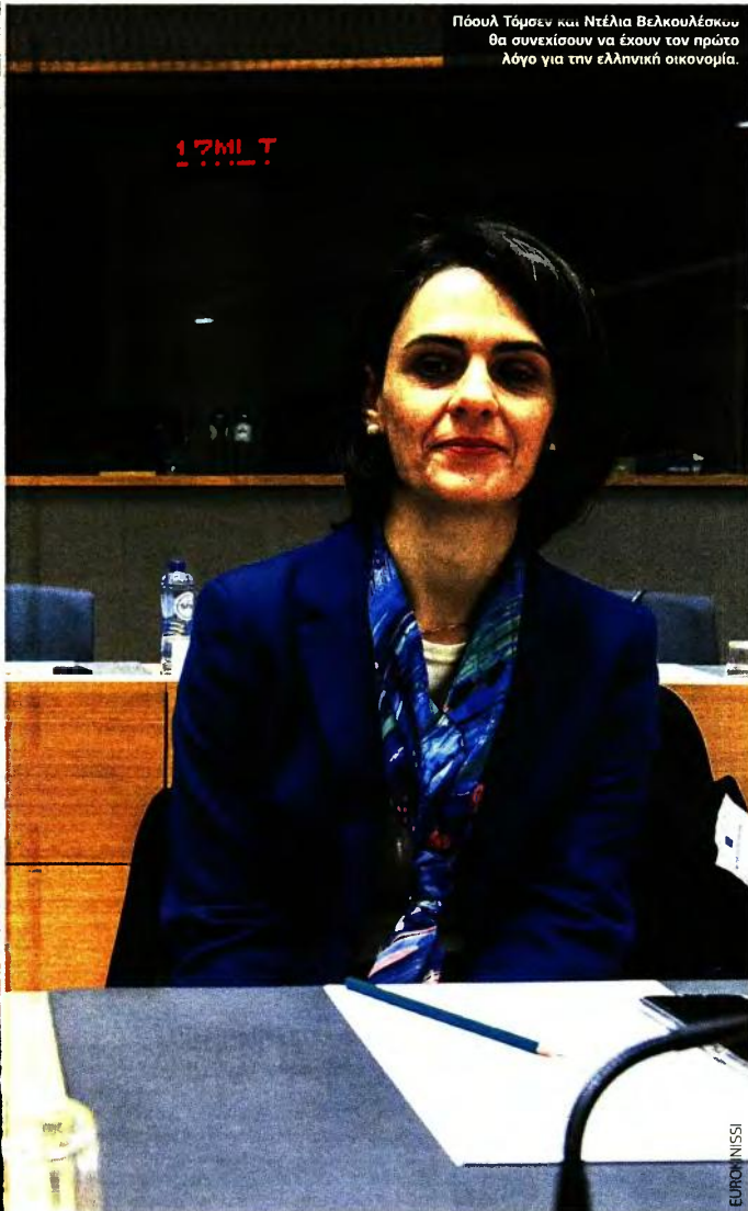
Πούλια Τσίμεν και Ντέλια Βελκουλέσκου θα συνεχίσουν να έχουν τον πρώτο λόγο για την ελληνική οικονομία.

►► ΟΙ ΕΤΑΙΡΟΙ ΔΕΝ ΔΕΙΚΝΟΥΝ ΔΙΑΘΕΣΗ ΓΙΑ ΣΗΜΑΝΤΙΚΗ ΕΛΑΦΡΥΝΣΗ