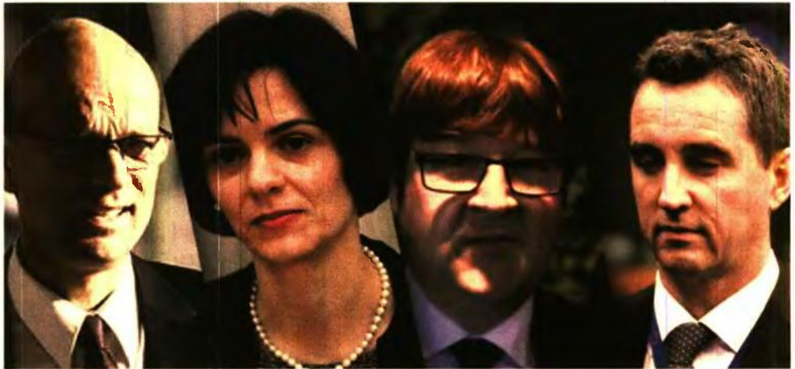
»»» Ράσμους Ρέφερ

Πιο αναλυτικά, στο νομοσχέδιο του υπουργείου Εργασίας προβλέπονται μεγάλες περικοπές των καινούργιων συντάξεων που θα χορηγηθούν μετά την