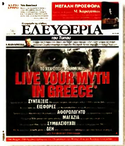
Ο Ευκλείδης Τσακαλώτος (δεξιά) με τον Τάσο Πετρόπουλο σε παλαιότερο στιγμιότυπο από τη Βουλή. Αριστερά: Το κθεσινό πρωτοσέλιδο της «ΕΛΕΥΘΕΡΙΑΣ του Τύπου»