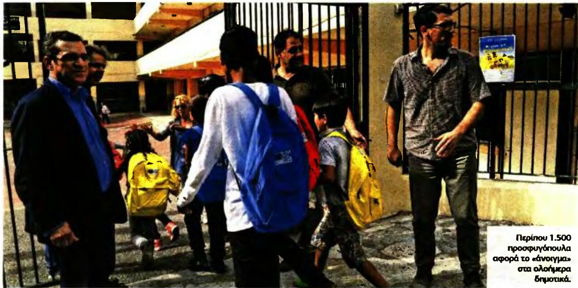
Περίπου 1.500 προσφυγόπουλα αφορά το «άνοιγμα» στα ολοήμερα δημοτικά.

ΟΛΟΗΜΕΡΑ ΔΗΜΟΤΙΚΑ: ΜΕΤ' ΕΜΠΟΔΙΩΝ Η ΦΟΙΤΗΣΗ 1.500 ΠΑΙΔΙΩΝ