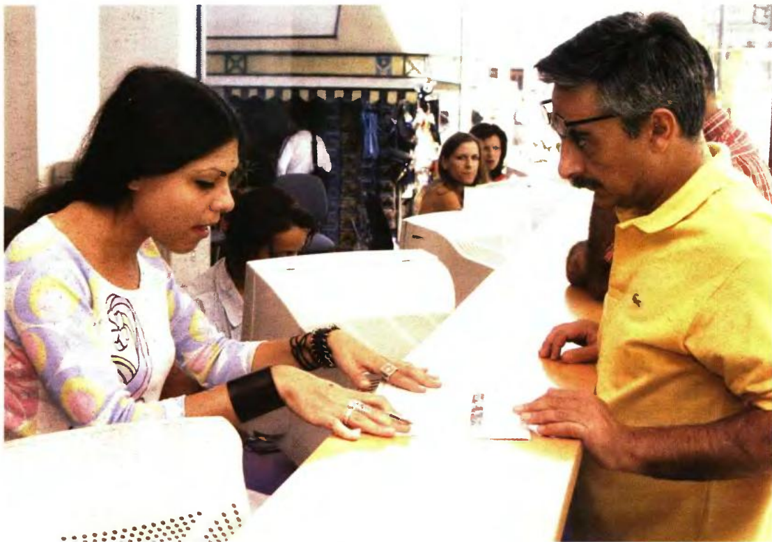
Οι πέντε ευνοϊκές ασφαλιστικές διατάξεις απευθύνονται σε παλαιούς ασφαλισμένους, υπό την προϋπόθεση ότι έπιασαν τα απαιτούμενα έτη ασφάλισης μέχρι τις 18 Αυγούστου 2015

▶ Η έξοδος με πλήρη σύνταξη γίνεται στα 67 ή εναλλακτικά στα 62 με 40 έτη ασφάλισης, ανεξαρτήτως Ταμείου