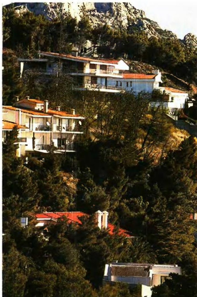
Η ΤΑΚΤΟΠΟΙΗΣΗ των αυθαιρέτων έχει αποφέρει ήδη έσοδα που φτάνουν το 1,5 δις-σεκατομμύριο ευρώ, ενώ έχει προϋπολογιστεί η είσπραξη ακόμα 1,8 δις. ευρώ

Στην παρούσα φάση εκτιμήθηκε ότι δεν είχε νόημα η διαφοροποίηση στα