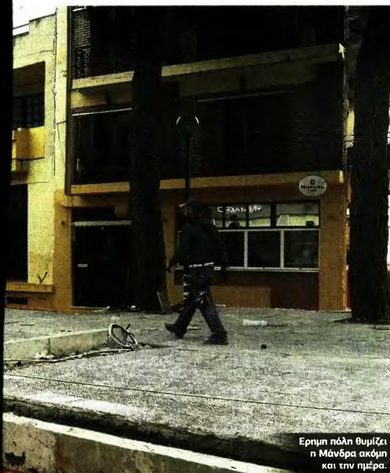
Ερημη πόλη θυμίζει η Μάνδρα ακόμη και την ημέρα.

δασοαρχείο, το οποίο προσδιόρισε τον Δεκέμβριο ποιες εκτάσεις ήταν δασικές και ποιες όχι. Στη συνέχεια, έπρεπε να εντοπιστούν ποιες ιδιοκτησίες είναι ιδιωτικές και σε ποιον ανήκουν, το οποίο τελείωσε τον Ιανουάριο», τονίζει ο κ. Βασιλείου. Όπως σημείωσε, τώρα σειρά έχει να υποβάλουν εντός δύο μηνών οι ενδιαφερόμενοι τις ενστάσεις τους για τις απαλλοτριώσεις. Όταν ολοκληρωθεί και αυτό το βήμα και θα έχουν οριστικοποιηθεί οι ιδιοκτησίες, θα γίνει το δικαστήριο για να καθορισθεί πόσο κοστολογείται το στρέμμα και πόσα χρήματα θα πάρουν τελικά οι πολίτες από την απαλλοτρίωση. Αφού όλα τα παραπάνω τελειώσουν και δεν υπάρξουν «απρόοπτα» τότε μπορεί να γίνει η δημοπράτηση του έργου, με τον εργολάβο να έχει στη διάθεσή του περίπου 18 μήνες για να διευθετήσει τα ρέματα.