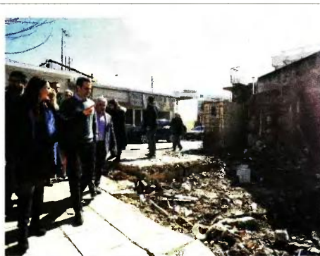
Για τρίτη φορά, μετά τις καταστροφικές πλημμύρες του περασμένου Νοεμβρίου, ο Κυριάκος Μητσοτάκης βρέθηκε κοντά στους πλημμυροπαθείς.