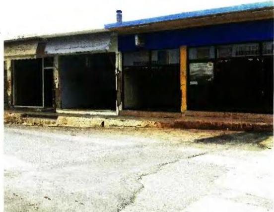
Τα σημερινά «κουφάρια» κτιρίων κάποτε στέγαζαν επιχειρήσεις.