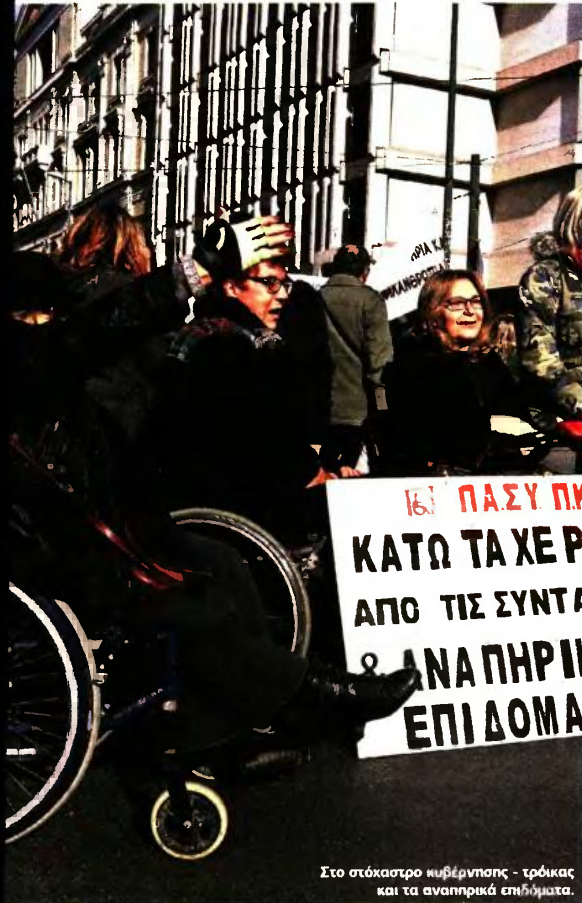
Στο στόκαστρο κυβέρνησης - τρόικας και τα αναπηρικά επιδόματα.