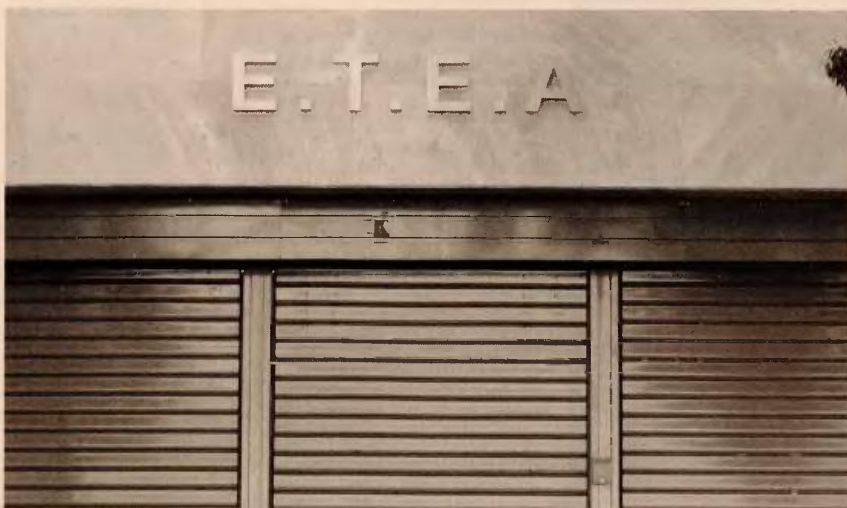
Οι εκπρόσωποι των δανειστών και κυρίως του ΔΝΤ διαφωνούν ριζικά με το ενδεχόμενο αύξησης των εισφορών υπέρ του ΕΤΕΑ, με αποτέλεσμα να ζητούν μεγάλες μειώσεις στις ήδη καταβαλλόμενες επικουρικές συντάξεις.

Απόλυτη διάσταση απόψεων σε όλα τα κεντρικά θέματα του ασφαλιστικού κατεγράφη χθες κατά την τρίτη κρίσιμη συνάντηση της ηγεσίας του υπουργείου Εργασίας με τους εκπροσώπους των δανειστών. «Ανοιξαμε όλα τα θέματα, δεν κλείσαμε κανένα». Η φράση ανήκει σε κυβερνητικό στέλεχος, εξερχόμενο από τη διαπραγμάτευση. Είναι το ίδιο στέλεχος που πριν από τη συνάντηση δήλωσε αποφασισμένο να προχωρήσει στις απαιτούμενες υποχωρήσεις, μέσω της κατάθεσης νέων προτάσεων, προκειμένου να κλείσει η συμφωνία εντός της εβδομάδας. Κατά τη διάρκεια της συνάντησης, όμως, ασφαλείς πληροφορίες αναφέρουν πως οι διαφωνίες μεταξύ των θεσμών ήταν τόσο εμφανείς, που δυσχέραναν την όποια προσπάθεια διαπραγμάτευσης. Αναλυτικά, οι εκπρόσωποι των δανειστών και κυρίως του Διεθνούς Νομισματικού Ταμείου διαφωνούν κάθεται με το ενδεχόμενο αύξησης των εισφορών υπέρ του Ενιαίου Ταμείου Επικουρικής Ασφάλισης, με αποτέλεσμα να ζητούν μεγάλες μειώσεις στις ήδη καταβαλλόμενες επικουρικές συντάξεις. Κατά πληροφορίες, μάλιστα, χθες αμφισβητήθηκε ακόμη και η συμφωνία που έχει επιτευχθεί με-