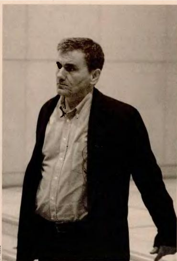
Ο υπουργός Οικονομικών Ευκλείδης Τσακαλώτος κατά την αποχώρησή του, ύστερα από τη συνάντηση με τους εκπροσώπους των δανειστών.

Οι διαφορές αυτές αναδεικνύονται την ώρα που ο χρόνος πιέζει ασφυκτικά όλους τους εμπλεκόμενους φορείς, και ιδίως την κυβέρνηση, για να επιτευχθεί συμφωνία. Μάλιστα, για να γεφυρωθούν οι διαφορές, είναι