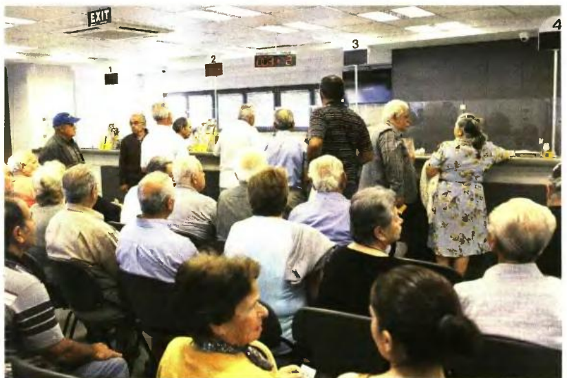
Νέα μικρολousία για το ύψος των συντάξεων φέρνει το ασφαλιστικό.

1 Ψαλίδι -ως και 30%- στις επικουρικές συντάξεις, καθώς δεν «περνάει» από την τρόικα πρόταση του υπουργείου για αύξηση των εργοδοτικών εισφορών, ώστε να είναι μικρότερες οι περικοπές στις συντάξεις. Το υπουργείο πρότεινε την αύξηση εισφορών στην επικουρική ασφάλιση ως «πακέτο» (οι εργοδότες από 3% σε 4% και οι εργαζόμενοι από 3% σε 3,5%), που σημαίνει ότι πολύ δύσκολα θα επιλέξει να φορτώσει τα βάρη μόνο στη μια πλευρά, αυτή των εργαζομένων. Η τρόικα με το βέτο για τις εργοδοτικές εισφορές έκλεισε και το δρόμο για αυξήσεις εισφορών στους εργαζόμενους.