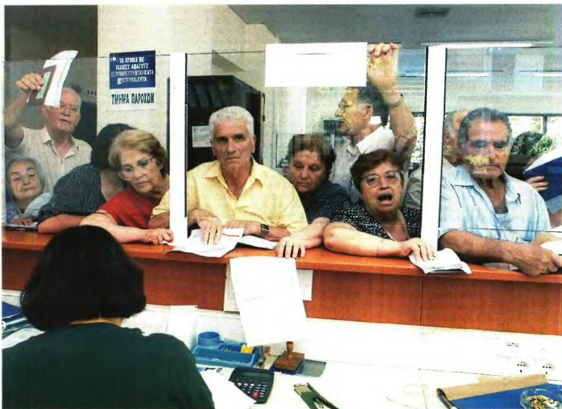
Ευνοϊκές διατάξεις ισχύουν μόνο για όσους ασφαλισμένους πρόλαβαν να συμπληρώσουν την 35ετία μέχρι το τέλος του 2012, καθώς από 1ης Ιανουαρίου 2013 ισχύει ενιαίο καθεστώς και η έξοδος γίνεται με 40 έτη σε ηλικία 62 ετών

Καθοριστικός παράγοντας για την έξοδο είναι το ποια χρόνια συμπληρώθηκαν οι 10.500 ημέρες ασφάλισης. Εφόσον η 35ετία συμπληρώθηκε μέχρι και το 2011, φέτος καταβάλλεται σύνταξη στα