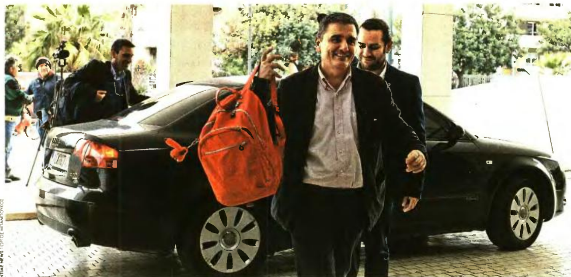
INFORM NEWS / ΓΙΩΡΓΟΣ ΚΑΤΡΟΥΓΚΑΛΗΣ

Τον νομο του Πάρκινσον επικαλέστηκε ο υπουργός Οικονομικών Ευκλείδης Τσακαλώτος δικαιολογώντας την καθυστέρηση στο κλείσιμο της συμφωνίας, προσέθεσε αλλωστε ότι υπάρχει χρόνος έως την Παρασκευή