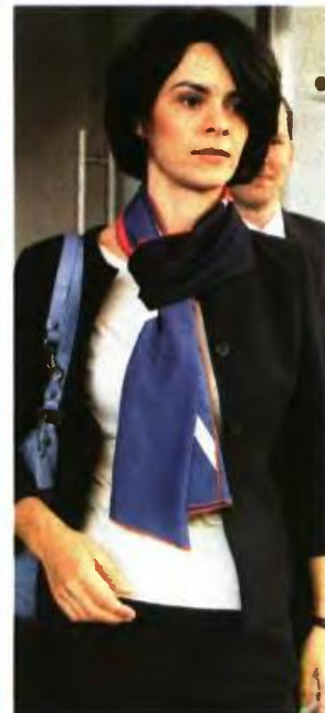
ΚΥΒΕΡΝΗΤΙΚΕΣ ΠΗΓΕΣ ανέφεραν πως οι δανειστές εμφανίστηκαν με δύο γραμμές, με αυτή του ΔΝΤ να απέχει από των Ευρωπαίων διαπραγματευτών