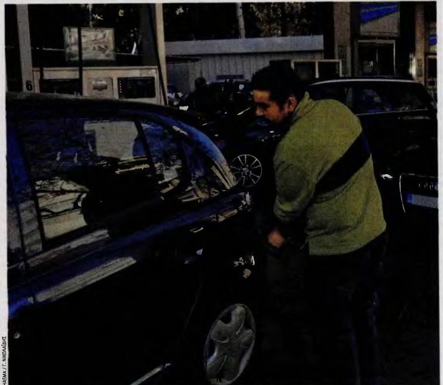
Από τον Ιανουάριο του 2017 θα εφαρμοσθεί η αύξηση των ειδικών φόρων κατανάλωσης σε βενζίνη, ντίζελ για κίνηση και θέρμανση, LPG και κηροζίνη.