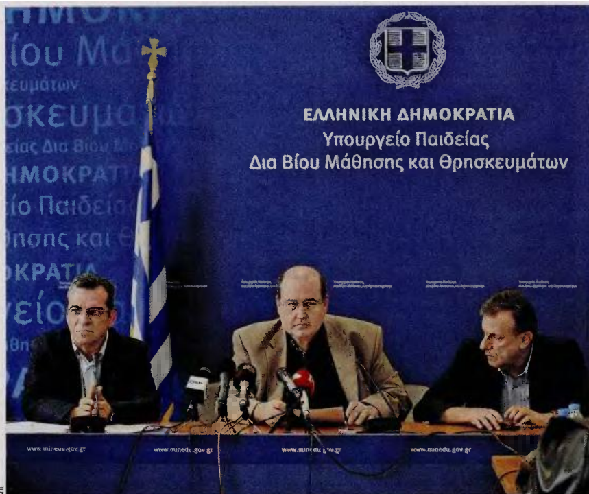
Στη χθεσινή συνέντευξη Τύπου, ο Ν. Φίλνς προκάλεσε αίσθηση λέγοντας για τις Πανελλαδικές ότι «όσο υπάρχει ο θεσμός, πρέπει να διασφαλίζουμε τα στοιχεία που κρίνουν την αντικειμενικότητά του. Όσο υπάρχει».

«Και φέτος οι εξετάσεις θα είναι άψογες, θα είναι αδιάβλητες. Όσο υπάρχει αυτός ο θεσμός, πρέπει να διασφαλίζουμε τα στοιχεία εκείνα τα οποία κρίνουν την αντικειμενικότητά του. Όσο υπάρχει», είπε ο κ. Φίλνς. Η κατάληξη της δήλωσής του, ωστόσο, προκάλεσε ερωτήσεις-σχόλια περί αλλαγής του συστήματος πρόσβασης στην τριτοβάθμια εκπαίδευση, με αποτέλεσμα ο υπουργός να τονίσει ότι δεν πρόκειται να ληφθούν άμεσες και βιαστικές