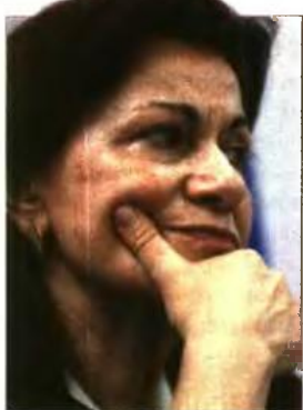
Η Θεανώ Φωτίου

ΑΝΑΠΡΟΣΑΡΜΟΓΗ -δηλαδή, περικοπή- των προνοιακών επιδομάτων στο πλαίσιο της δημιουργίας ενιαίου φορέα παροχής τους (από 1/1/2018) προανήγγειλε η αναπληρώτρια υπουργός Κοινωνικής Αλληλεγγύης Θεανώ Φωτίου. Αποκάλυψε δε ότι επιδόματα ύψους 12.500.000 ευρώ δόθηκαν σε πολίτες που δεν τα δικαιούνταν (από το 2013 έως σήμερα) και θα αναζητηθούν... μέσω της Εφορίας!