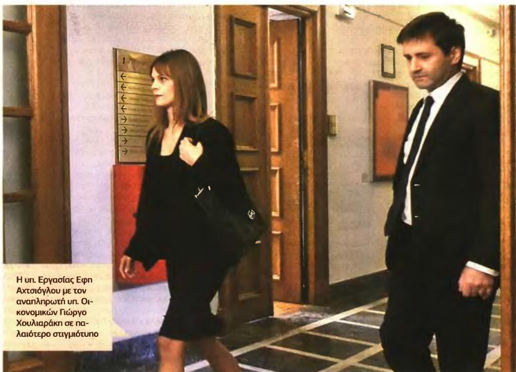
Η υπ. Εργασίας Εφη Αχτσιόγλου με τον αναπληρωτή υπ. Οικονομικών Γιώργο Χουλιαράκη σε παλαιότερο στιγμιότυπο

Πάντως, ο διοικητής του ΕΦΚΑ δήλωσε προσφάτως στη Βουλή ότι έως φέτος τον Νοέμβριο θα έχουν απονεμηθεί οι 138.000 κύριες συντάξεις που εκκρεμούν, ενώ ο υφυπουργός Εργασίας Τάσος Πετρόπουλος είχε προαναγγείλει τον Φεβρουάριο την απονομή όλων των εκκρεμών συντάξεων έως τον Οκτώβριο. Και οι δύο όμως διαψεύστηκαν.