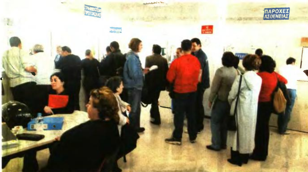
ΣΕ ΠΕΡΙΠΤΩΣΗ μειωμένης σύνταξης για ασφαλισμένο του ΟΑΕΕ, το ποσό μειώνεται κατά 1/200 για κάθε μήνα που υπολείπεται για τη συμπλήρωση του ορίου ηλικίας πλήρους συνταξιοδότησης