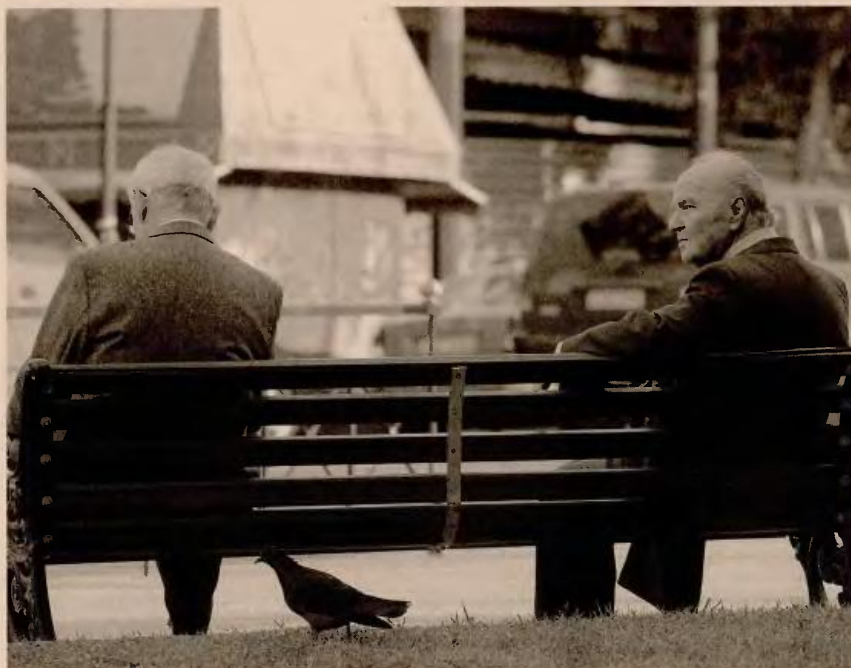
«Τυχεροί» θεωρούνται οι χαμηλοσυνταξιούχοι που έχασαν το ΕΚΑΣ (για ποσά άνω των 30 ευρώ τον μήνα), οι οποίοι απαλλάσσονται από τη συγκεκριμένη παρακράτηση.

Αναλυτικά, με εγκύκλιο που εστάλη στα ασφαλιστικά ταμεία, ξεκαθαρίζεται ότι από 1/7/2016 η εισφορά υγειονομικής περίθαλψης υπέρ ΕΟΠΥΥ καθορίζεται σε ποσοστό 6%, και υπολογίζεται επί του καταβαλλόμενου ποσού κύριας σύνταξης, αφού αφαιρεθούν τα ποσά που αντιστοιχούν στην εισφορά αλληλεγγύης των μνημονιακών νόμων του 2010 και του 2011. Σε περίπτωση συρροής περισσότερων της μιας κύριων συντάξεων στο ίδιο πρόσωπο, το 6% υπολογίζεται στο άθροισμα των καταβαλλόμενων συν-