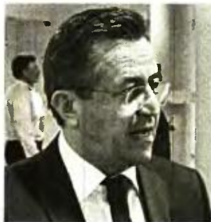
Ο ανεξάρτητος βουλευτής Νίκος Νικολόπουλος σημειώνει ότι οι πολύπαθες πολύτεκνες οικογένειες βάλλονται από τις μνημονιακές πολιτικές

Ακόμα ένα χτύπημα δέχονται οι πολύτεκνες και τρίτεκνες