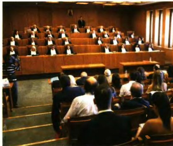
ΓΙΑ ΑΝΤΙΘΕΣΗ των νέων ρυθμίσεων για τις συντάξεις με τη νομολογία του ΣΤΕ και το δεδικασμένο περσινών αποφάσεών του κάνουν λόγο οι συνταξιούχοι

Στην Ολομέλεια του Συμβουλίου της Επικρατείας αναμένεται να οδηγηθούν οι αιτήσεις ακύρωσης που υπέβαλαν η ΠΟΠΣ (Πανελλήνια Ομοσπονδία Πολιτικών Συνταξιούχων) και το Ενιαίο Δίκτυο Συνταξιούχων (καλύπτοντας όλο το φάσμα