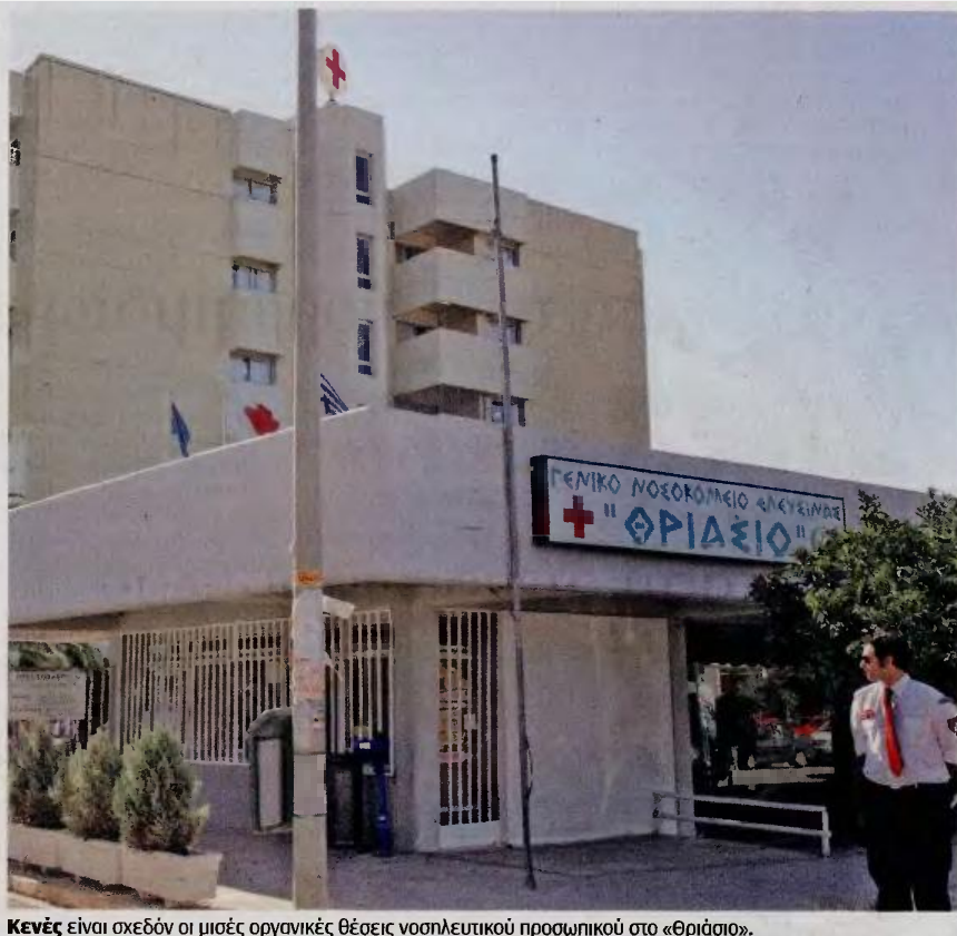
Κενές είναι σχεδόν οι μισές οργανικές θέσεις νοσηλευτικού προσωπικού στο «Θριάσιο».

«Τα νοσοκομεία, τα κέντρα υγείας, το ΕΚΑΒ είναι υπό διάλυση», σημειώνει η ΠΟΕΔΗΝ, που επιτίθεται για άλλη μία φορά στον πρωθυπουργό κ. Τσίπρα και στην ηγεσία του υπουργείου Υγείας, τονίζοντας ότι «σύντομα θα κληθούν να απολογηθούν για την καταστροφή του ΕΣΥ».