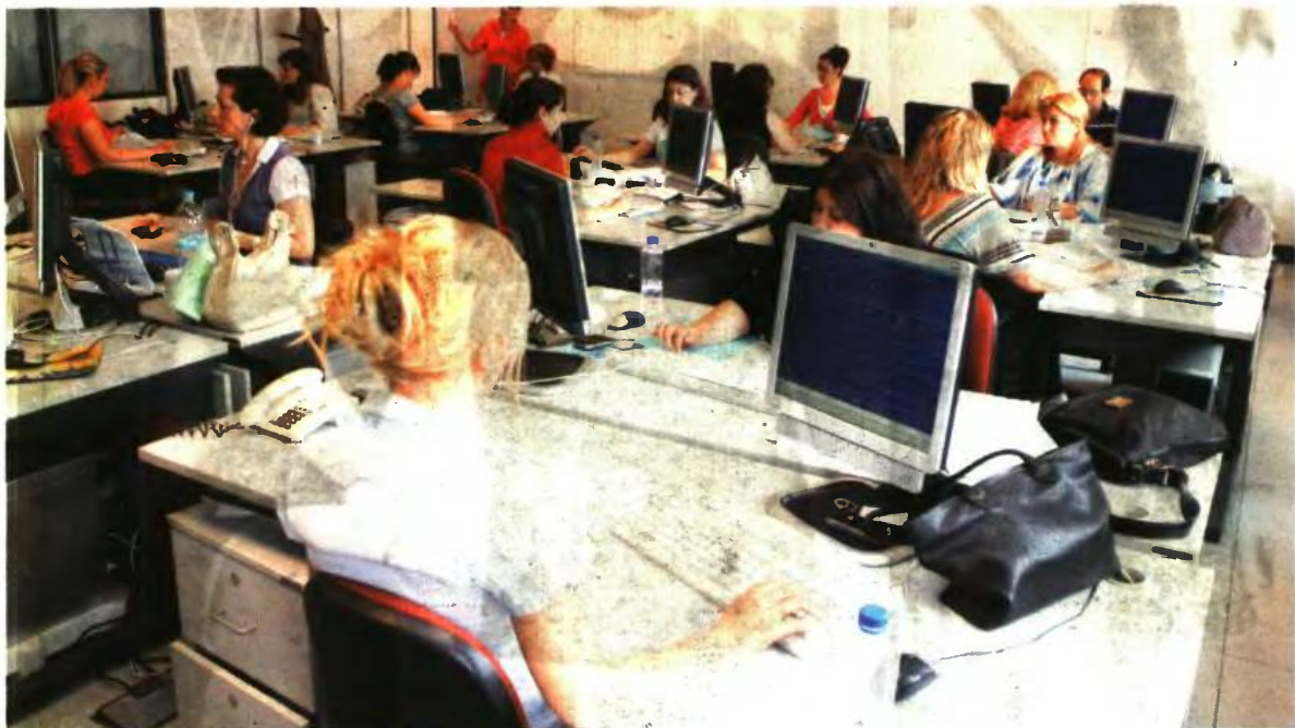
ΤΑ ΕΚΚΑΘΑΡΙΣΤΙΚΑ θα είναι πολλών ταχυτήτων με επιβαρύνσεις, ελαφρύνσεις αλλά και καμία μεταβολή στο ύψος του φόρου σε σχέση με τα περσινά

Τα εκκαθαριστικά θα αρχίσουν να αναρτώνται σταδιακά στους ατομικούς λογαριασμούς του Taxisnet