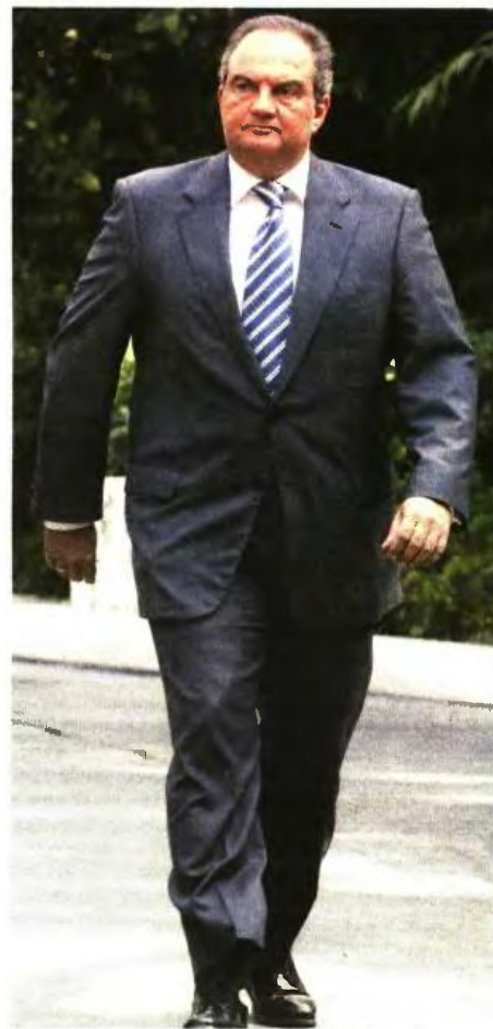
Σύμφωνα με πληροφορίες, η κυβερνητική πλειοψηφία έχει σκοπό να ταράξει τα νερά με μια σειρά από Εξεταστικές Επιτροπές στη Βουλή, οι οποίες θα λειτουργήσουν εξιλεωτικά για την κυβερνητική θητεία Καραμανλή.