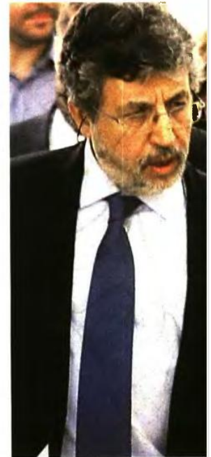
Ο πρωθυπουργός Αλέξης Τσίπρας με τον πρόεδρο της Επιτροπής για την Αναθεώρηση του Συντάγματος Μιχάλη Σπουρδαλάκη. Αριστερά: Ο Χρ. Βερναδάκης (πάνω) και ο Γ. Κατρούγκαλος (κάτω)

Προσεκτικός «διαχωρισμός» Εκκλησίας - Κράτους με υποχρεωτικό πολιτικό όρκο και επικρατούσα θρησκεία την Ορθοδοξία. Με ωραιοποιημένες εκφράσεις η «κατοχύρωση» των κοινωνικών δικαιωμάτων και ο δημόσιος έλεγχος σε νερό και ρεύμα