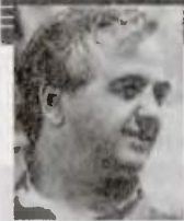
ΤΟΥ ΜΑΚΗ ΚΟΥΦΡΗ

Κάθε μέρα ό,τι συμβαίνει στο blog makiskouris.paron.gr