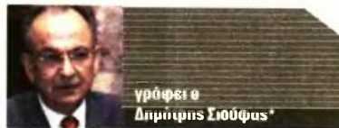
γράφει ο Δημήτρης Σιούφας*

Γ ια να αναδειχθεί κάποιο πρόβλημα ιδρύεται αντίστοιχο υπουργείο... Αυτά είχαν και έχουν ως συνέπεια να αναστατώνεται μέχρι παράλυσης η διοίκηση, να στερούνται οι υπουργοί πολύτιμων υπηρεσιακών συνεργατών, να δημιουργούνται αδικαιολόγητα έξοδα και να εντείνεται η ταλαιπωρία πολιτών και υπαλλήλων. Ως φυσικό επακόλουθο, όλες οι υπηρεσίες μέχρι να αποκτήσουν εκ νέου λειτουργική επάρκεια βρίσκονται σε αναμονή του επόμενου σχηματισμού ή ανασχηματισμού. Όλα τα παραπάνω θα ήταν αστεία αν δεν οδηγούσαν, μαζί με άλλα, στις τραγικές συνέπειες που ζούμε. Η κατάσταση αυτή δεν αρμόζει σε σοβαρή κρατική οντότητα. Καμμία δυτική δημοκρατία δεν ακολουθεί τους δικούς μας ρυθμούς υπουργικών αλλαγών. Δεν χρειάζεται να αναμένουμε τη συνταγματική αναθεώρηση για να συνεννοηθεί και να αυτοδυσμενεί το πολιτικό σύστημα, τα κοινοβου-