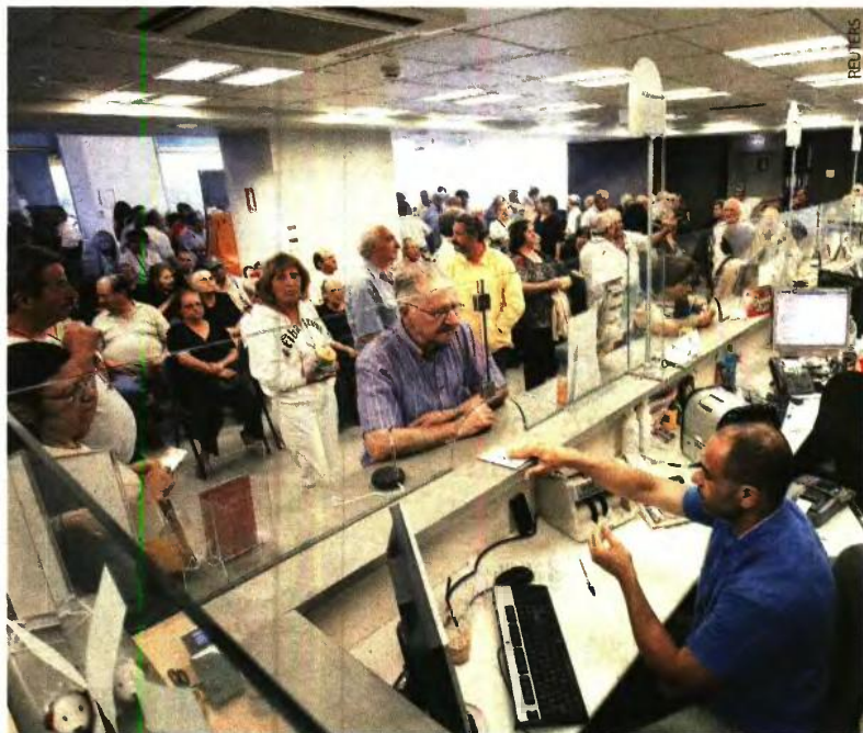
Οι περικοπές στις επικουρικές ξεκινούν στις 2 Αυγούστου. Αφορούν 260.000 δικαιούχους λέει ο Κατρούγκαλος, ενώ η ΗΔΙΚΑ εκτιμά ότι θίγονται 400.000.

Οι μειώσεις στις επικουρικές θα ξεκινήσουν στις 2 Αυγούστου είπε χθες ο υπουργός Εργασίας Γ. Κατρούγκαλος (στην πρωινή εκπομπή της ΕΡΤ) και ισχυρίστηκε ότι θα αφορούν 260.000 συνταξιούχους που έχουν άθροισμα μαζί με οποιαδήποτε άλλη